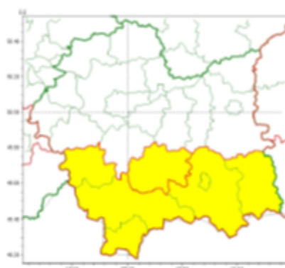
Roztopy 2022-12-21 18:42