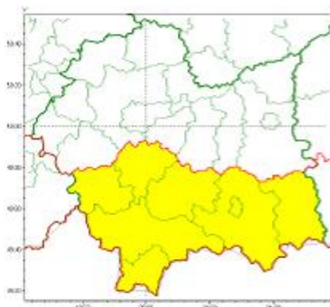
Oblodzenie 2021-12-19 13:06