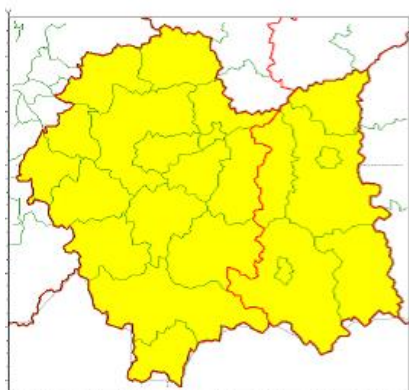
Upał 2021-07-15 08:55