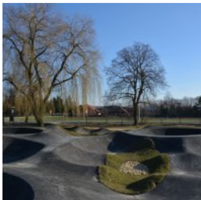
Pumptrack w Palczowicach oddany do użytku.