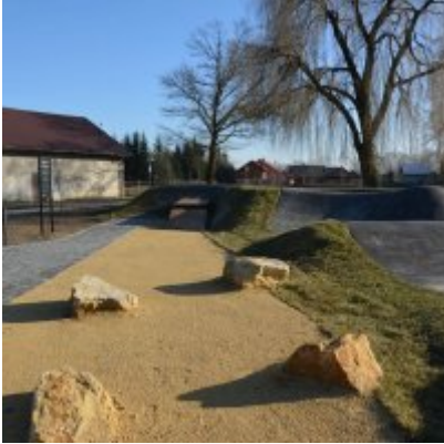
Pumptrack w Palczowicach oddany do użytku.