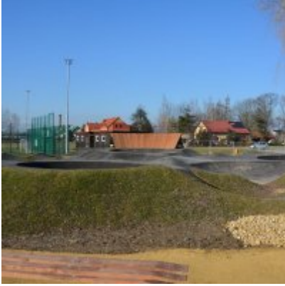
Pumptrack w Palczowicach oddany do użytku.