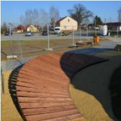
Pumptrack w Palczowicach oddany do użytku.