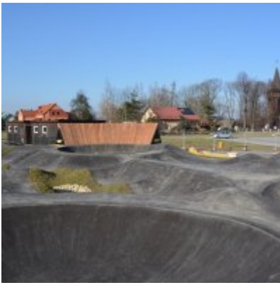
Pumptrack w Palczowicach oddany do użytku.