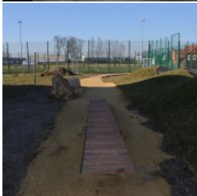
Pumptrack w Palczowicach oddany do użytku.