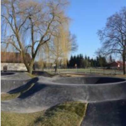
Pumptrack w Palczowicach oddany do użytku.