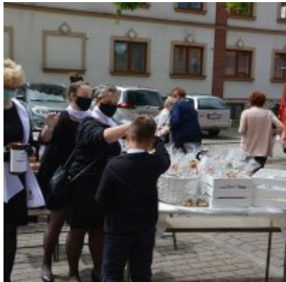
Nadanie patronatu Św. Rocha dla Miasta i Gminy Zator