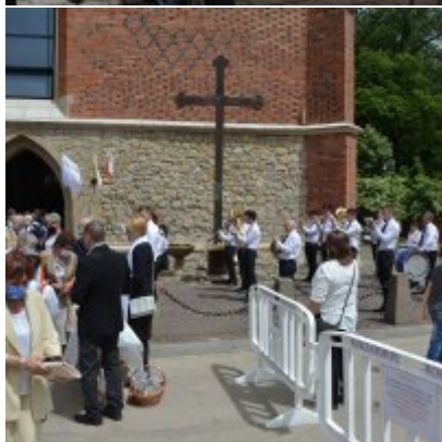
Nadanie patronatu Św. Rocha dla Miasta i Gminy Zator