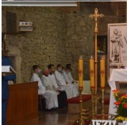
Nadanie patronatu Św. Rocha dla Miasta i Gminy Zator