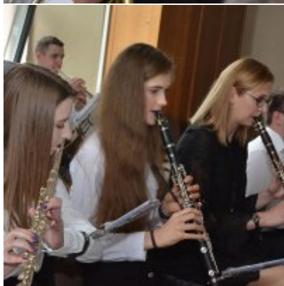
Nadanie patronatu Św. Rocha dla Miasta i Gminy Zator