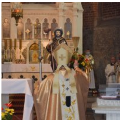
Nadanie patronatu Św. Rocha dla Miasta i Gminy Zator