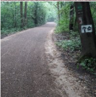
Szlak rowerowy od zamku w Zatorze do zamku w Graboszycach