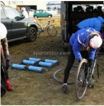
Znakomity start i rosnąca forma przed MP