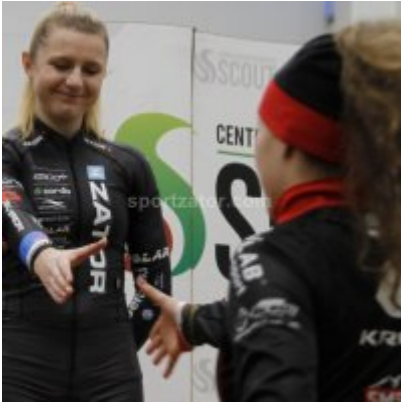
Znakomity start i rosnąca forma przed MP