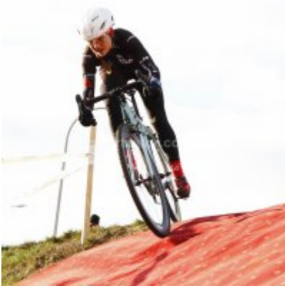
Znakomity start i rosnąca forma przed MP