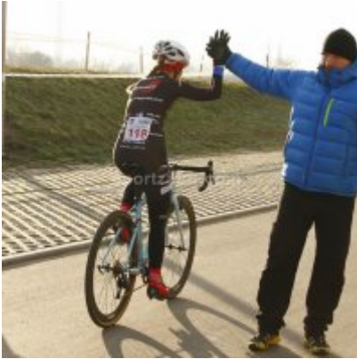
Znakomity start i rosnąca forma przed MP