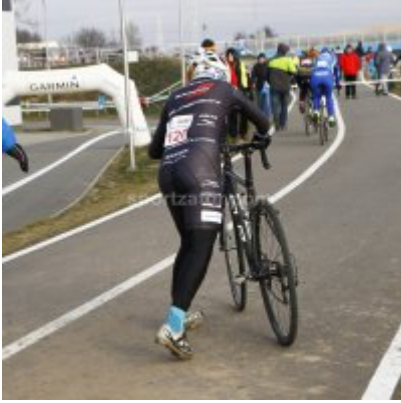
Znakomity start i rosnąca forma przed MP