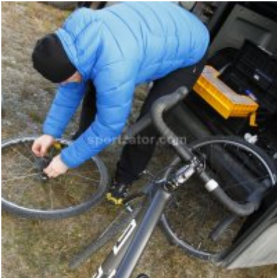
Znakomity start i rosnąca forma przed MP