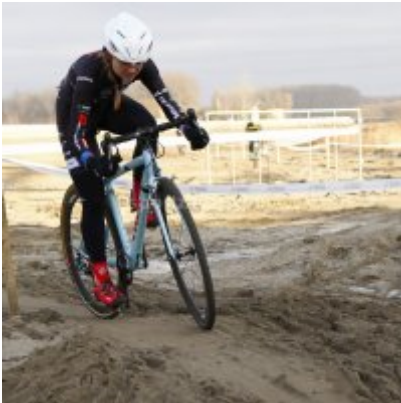
Znakomity start i rosnąca forma przed MP