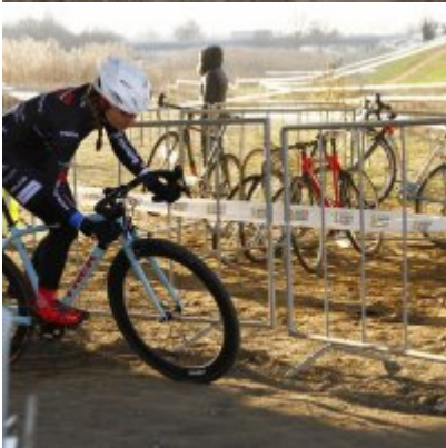
Znakomity start i rosnąca forma przed MP