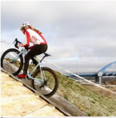
Znakomity start i rosnąca forma przed MP