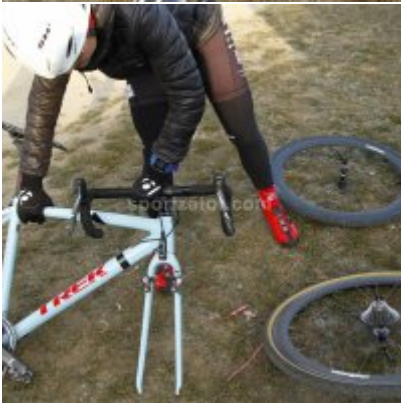
Znakomity start i rosnąca forma przed MP