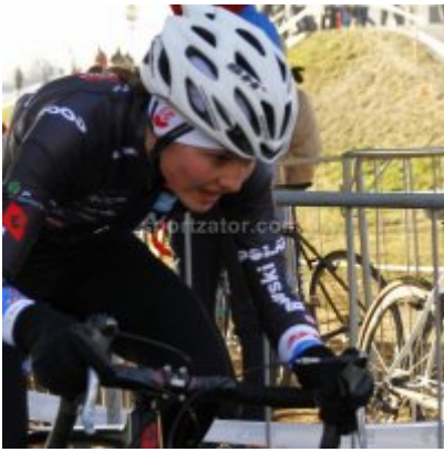
Znakomity start i rosnąca forma przed MP