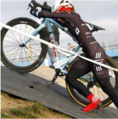
Znakomity start i rosnąca forma przed MP