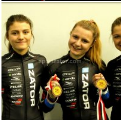
Znakomity start i rosnąca forma przed MP