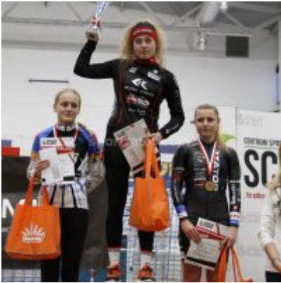
Znakomity start i rosnąca forma przed MP