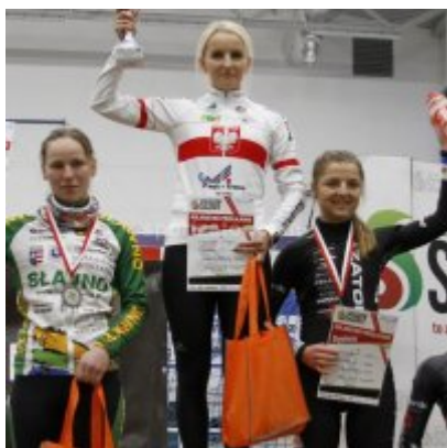
Znakomity start i rosnąca forma przed MP