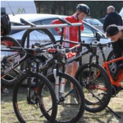
Zatorzanin na podium podczas Eliminacji Ogólnopolskiej Olimpiady Młodzieży!