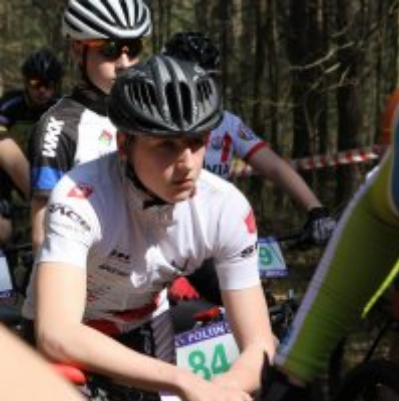
Zatorzanin na podium podczas Eliminacji Ogólnopolskiej Olimpiady Młodzieży!