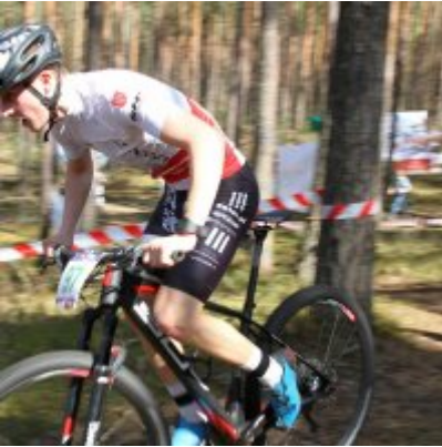
Zatorzanin na podium podczas Eliminacji Ogólnopolskiej Olimpiady Młodzieży!