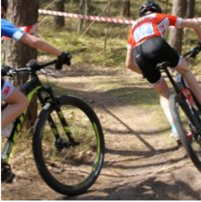
Zatorzanin na podium podczas Eliminacji Ogólnopolskiej Olimpiady Młodzieży!