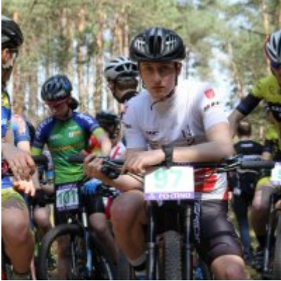
Zatorzanin na podium podczas Eliminacji Ogólnopolskiej Olimpiady Młodzieży!