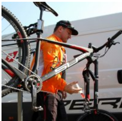
Zatorzanin na podium podczas Eliminacji Ogólnopolskiej Olimpiady Młodzieży!