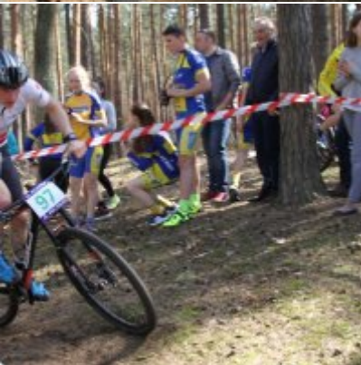
Zatorzanin na podium podczas Eliminacji Ogólnopolskiej Olimpiady Młodzieży!