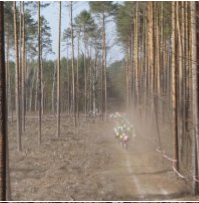
Zatorzanin na podium podczas Eliminacji Ogólnopolskiej Olimpiady Młodzieży!