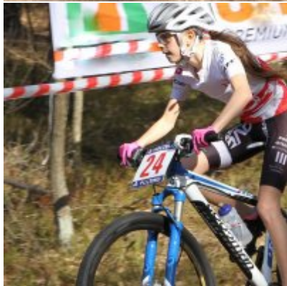
Zatorzanin na podium podczas Eliminacji Ogólnopolskiej Olimpiady Młodzieży!