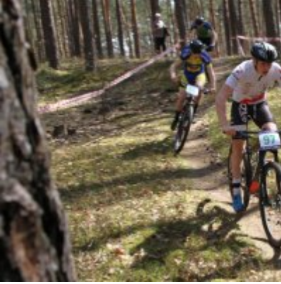
Zatorzanin na podium podczas Eliminacji Ogólnopolskiej Olimpiady Młodzieży!