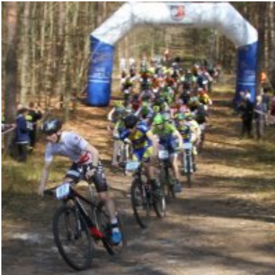
Zatorzanin na podium podczas Eliminacji Ogólnopolskiej Olimpiady Młodzieży!