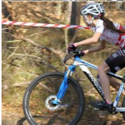
Zatorzanin na podium podczas Eliminacji Ogólnopolskiej Olimpiady Młodzieży!