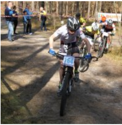
Zatorzanin na podium podczas Eliminacji Ogólnopolskiej Olimpiady Młodzieży!