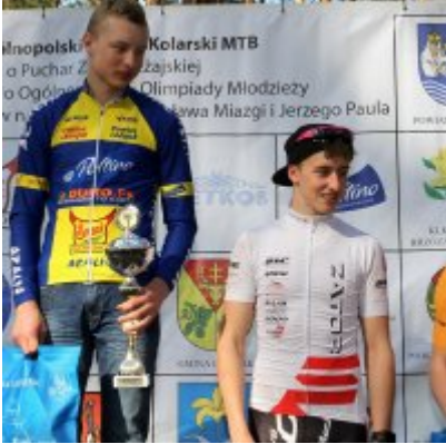
Zatorzanin na podium podczas Eliminacji Ogólnopolskiej Olimpiady Młodzieży!