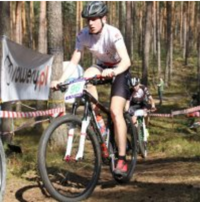
Zatorzanin na podium podczas Eliminacji Ogólnopolskiej Olimpiady Młodzieży!