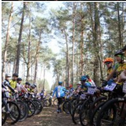
Zatorzanin na podium podczas Eliminacji Ogólnopolskiej Olimpiady Młodzieży!