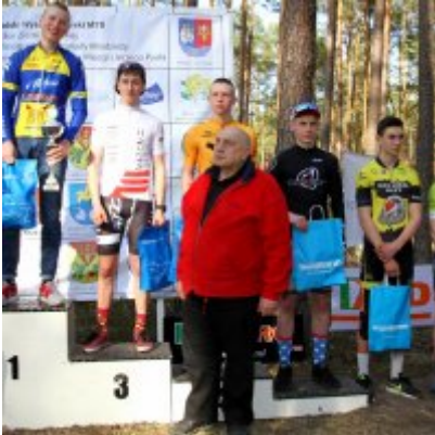
Zatorzanin na podium podczas Eliminacji Ogólnopolskiej Olimpiady Młodzieży!