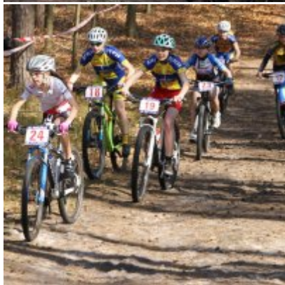
Zatorzanin na podium podczas Eliminacji Ogólnopolskiej Olimpiady Młodzieży!