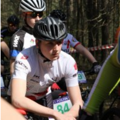
Zatorzanin na podium podczas Eliminacji Ogólnopolskiej Olimpiady Młodzieży!