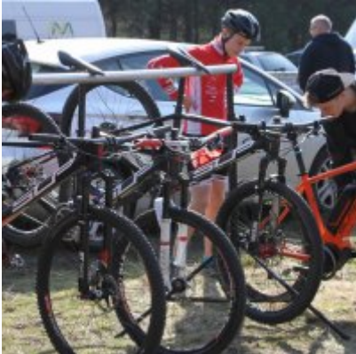
Zatorzanin na podium podczas Eliminacji Ogólnopolskiej Olimpiady Młodzieży!