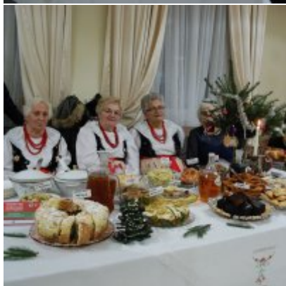
Zatorski Karp na Świątecznym Stole