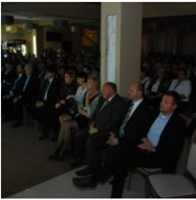
Zatorski Karp na Świątecznym Stole