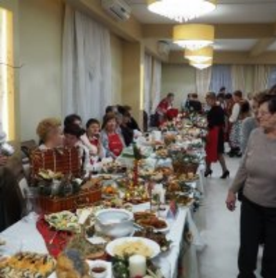
Zatorski Karp na Świątecznym Stole WZS ZATOR