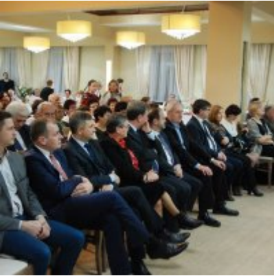
Zatorski Karp na Świątecznym Stole