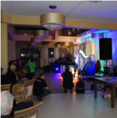
Zatorski Karp na Świątecznym Stole