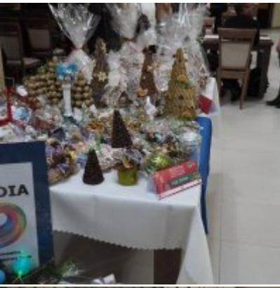
Zatorski Karp na Świątecznym Stole WZS ZATOR