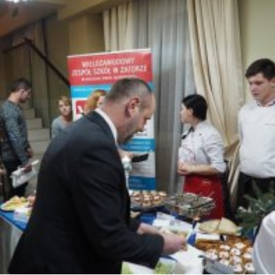
Zatorski Karp na Świątecznym Stole WZS ZATOR