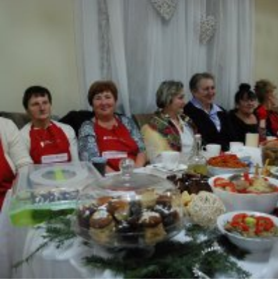
Zatorski Karp na Świątecznym Stole