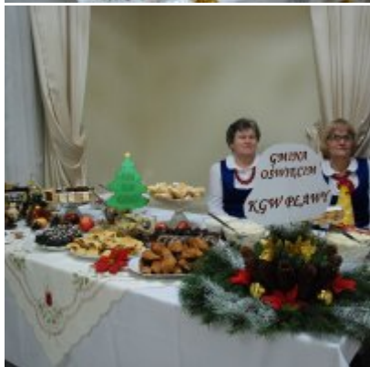
Zatorski Karp na Świątecznym Stole