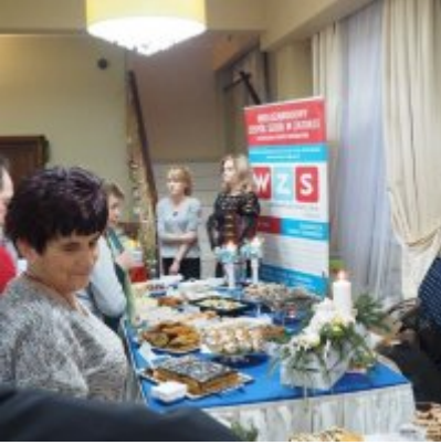
Zatorski Karp na Świątecznym Stole WZS ZATOR