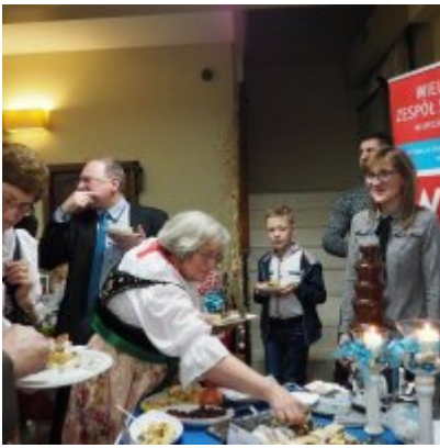
Zatorski Karp na Świątecznym Stole WZS ZATOR