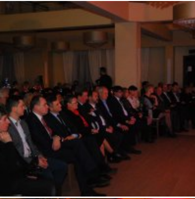
Zatorski Karp na Świątecznym Stole