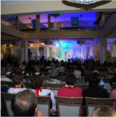
Zatorski Karp na Świątecznym Stole