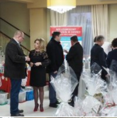
Zatorski Karp na Świątecznym Stole WZS ZATOR