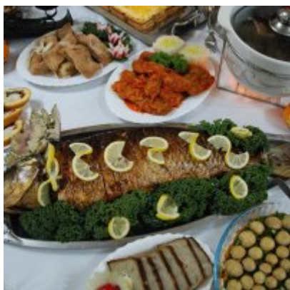
Zatorski Karp na Świątecznym Stole