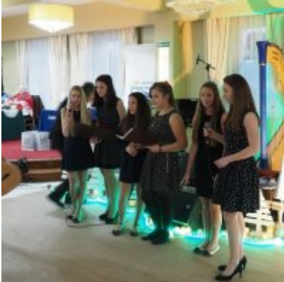
Zatorski Karp na Świątecznym Stole WZS ZATOR