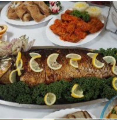
Zatorski Karp na Świątecznym Stole WZS ZATOR