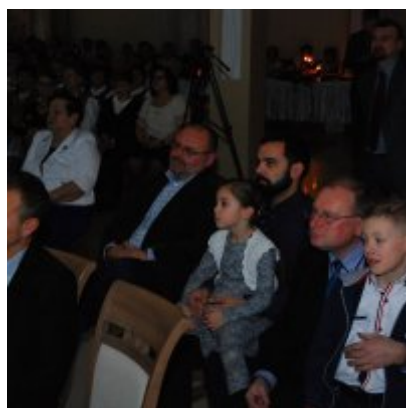
Zatorski Karp na Świątecznym Stole