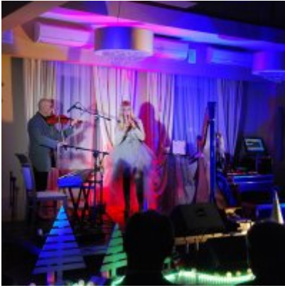
Zatorski Karp na Świątecznym Stole