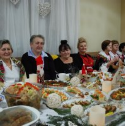
Zatorski Karp na Świątecznym Stole