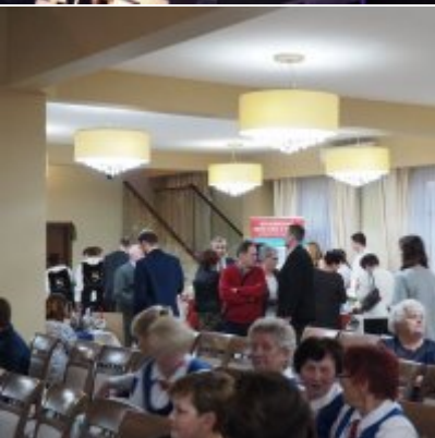
Zatorski Karp na Świątecznym Stole WZS ZATOR