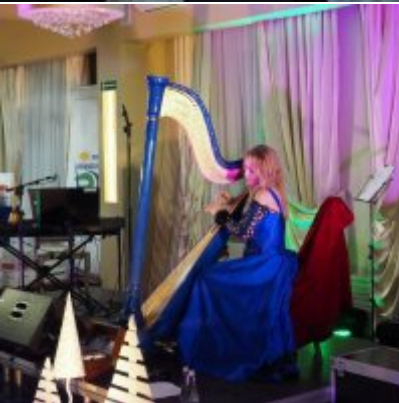
Zatorski Karp na Świątecznym Stole WZS ZATOR