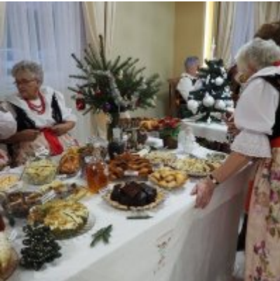
Zatorski Karp na Świątecznym Stole WZS ZATOR