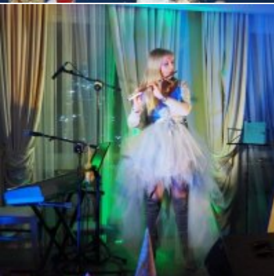
Zatorski Karp na Świątecznym Stole WZS ZATOR