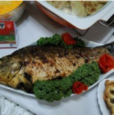
Zatorski Karp na Świątecznym Stole