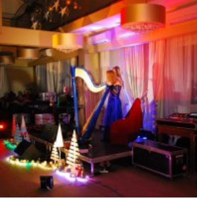
Zatorski Karp na Świątecznym Stole