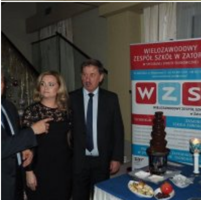
Zatorski Karp na Świątecznym Stole WZS ZATOR