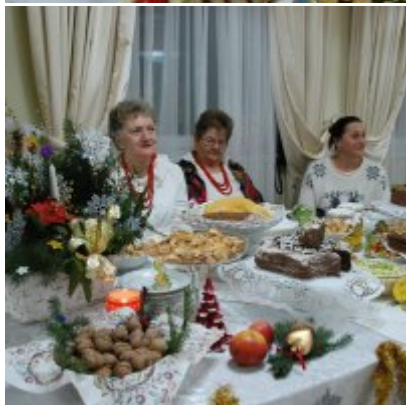
Zatorski Karp na Świątecznym Stole