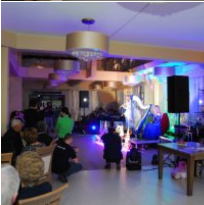
Zatorski Karp na Świątecznym Stole