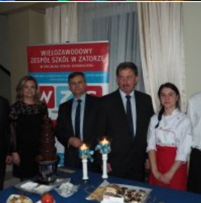
Zatorski Karp na Świątecznym Stole WZS ZATOR