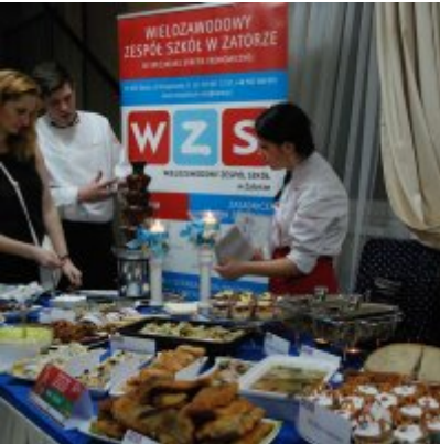
Zatorski Karp na Świątecznym Stole