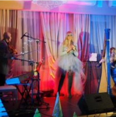
Zatorski Karp na Świątecznym Stole WZS ZATOR