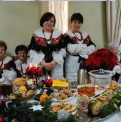
Zatorski Karp na Świątecznym Stole