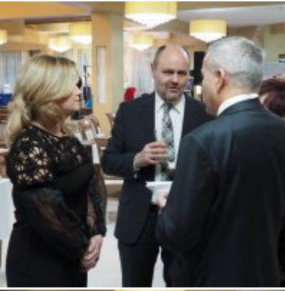
Zatorski Karp na Świątecznym Stole WZS ZATOR