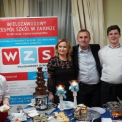
Zatorski Karp na Świątecznym Stole WZS ZATOR