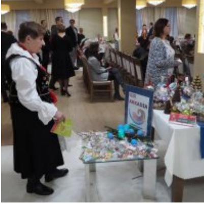
Zatorski Karp na Świątecznym Stole WZS ZATOR