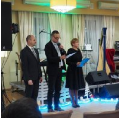
Zatorski Karp na Świątecznym Stole WZS ZATOR