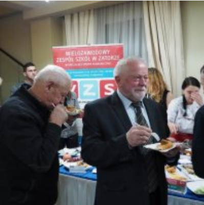
Zatorski Karp na Świątecznym Stole WZS ZATOR