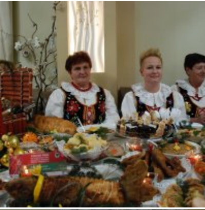
Zatorski Karp na Świątecznym Stole