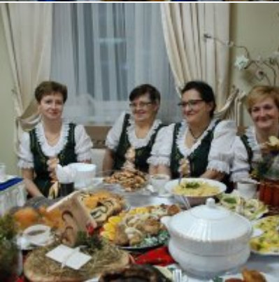
Zatorski Karp na Świątecznym Stole