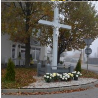
Zator wspiera producentów chryzantem.