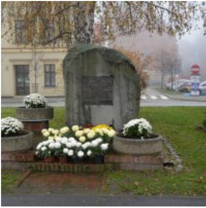
Zator wspiera producentów chryzantem.