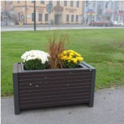
Zator wspiera producentów chryzantem.