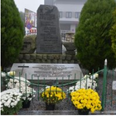
Zator wspiera producentów chryzantem.