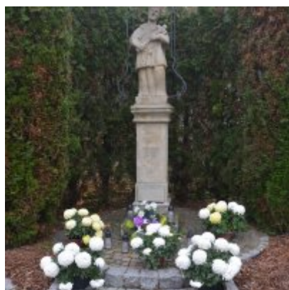
Zator wspiera producentów chryzantem