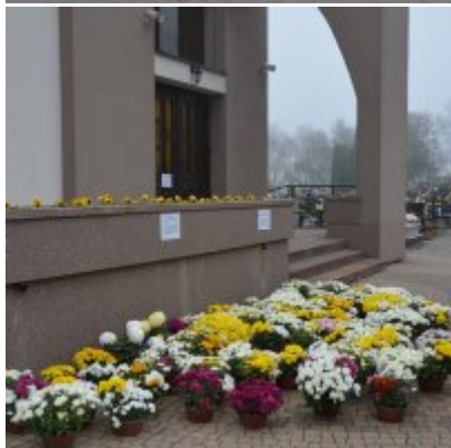
Zator wspiera producentów chryzantem.