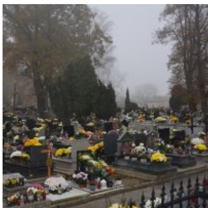
Zator wspiera producentów chryzantem.