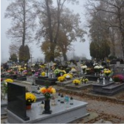
Zator wspiera producentów chryzantem.