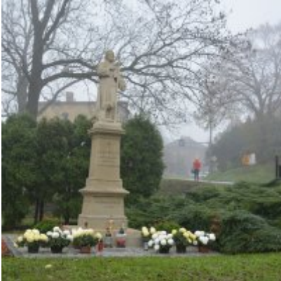
Zator wspiera producentów chryzantem.