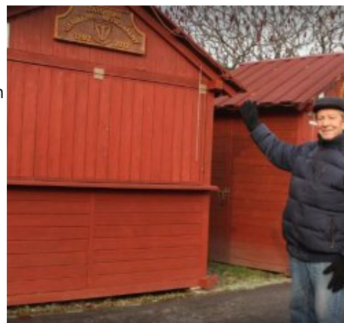
J. Zator

Gmina Zator, licząca niespełna 10 tys. mieszkańców, jest liderem pod względem pieniędzy wydawanych na inwestycje w Małopolsce zachodniej w rankingu „Wspólnoty”. W latach 2013-2015 w przeliczeniu na jednego mieszkańca wydano tam 1071 zł. To zdecydowanie najwięcej.