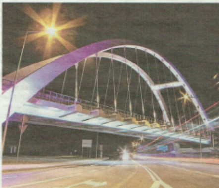
► Władukt nad ul. Trzebińską w Chrzanowie jest częścią obwodnicy północno-wschodniej, na którą uzyskano 72 mln zł unijnej dotacji

Sztandarową inwestycją w Zatorze zbudowaną z unijnym wsparciem jest strefa aktywności gospodarczej. Dotacja wyniosła prawie 17 mln zł przy pełnych kosztach 21 mln zł. - Niedawno mój chłopak dostał tam pracę w jednej z firm - cieszy się Patrycja Knapik, mieszkanka Zatora. W sumie od powstania strefy w grudniu 2012 r. działalność uruchomiło tutaj 10 przedsiębiorstw, w których pracę znalazło 300 osób. Kolejnych 11 firm jest w fazie budowy lub projektowania. W Zatorze oprócz tego z udziałem