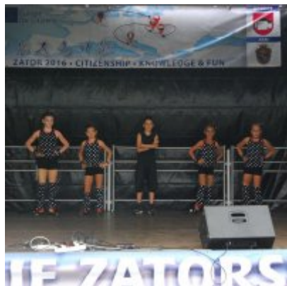
Zator 2016 Citizenship knowledge and fun