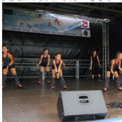
Zator 2016 Citizenship knowledge and fun