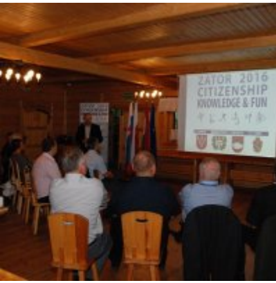
Zator 2016 Citizenship knowledge and fun.