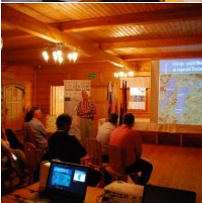
Zator 2016 Citizenship knowledge and fun