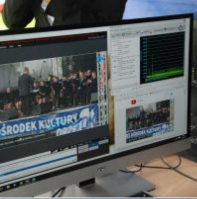
Zator 2016 Citizenship knowledge and fun.