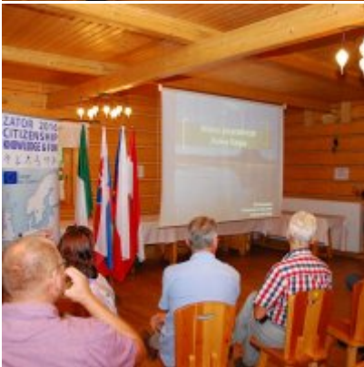
Zator 2016 Citizenship knowledge and fun