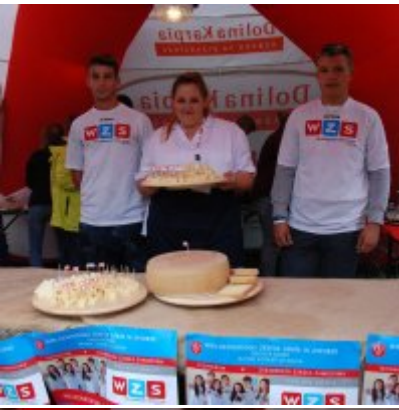
Zator 2016 Citizenship knowledge and fun.