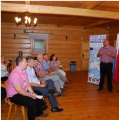
Zator 2016 Citizenship knowledge and fun