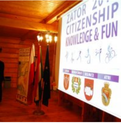
Zator 2016 Citizenship knowledge and fun.