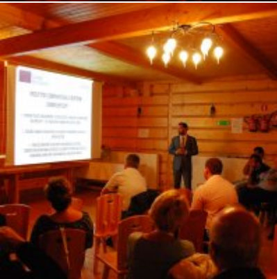
Zator 2016 Citizenship knowledge and fun.