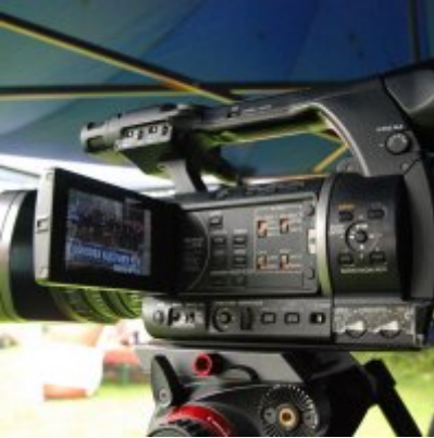
Zator 2016 Citizenship knowledge and fun.