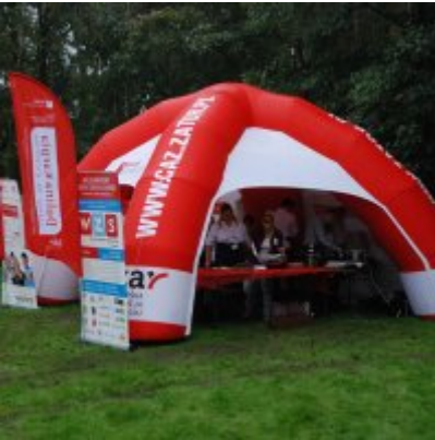
Zator 2016 Citizenship knowledge and fun.