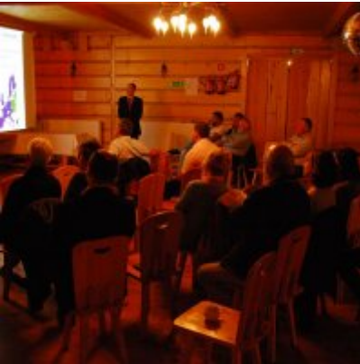
Zator 2016 Citizenship knowledge and fun.