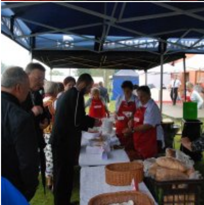
Zator 2016 Citizenship knowledge and fun