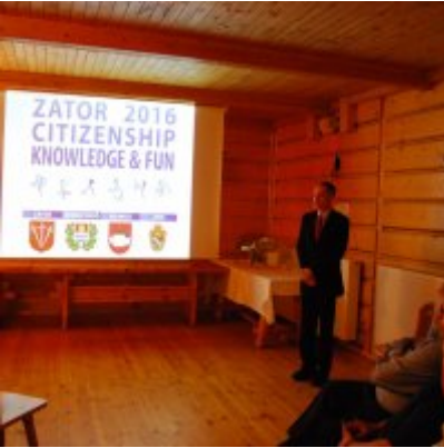
Zator 2016 Citizenship knowledge and fun.