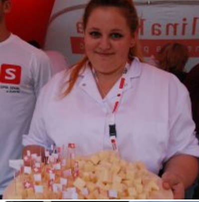
Zator 2016 Citizenship knowledge and fun.