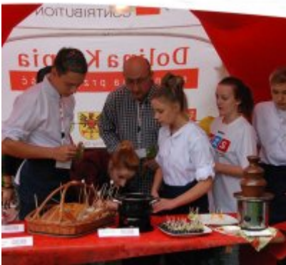
Zator 2016 Citizenship knowledge and fun