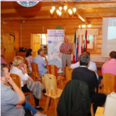
Zator 2016 Citizenship knowledge and fun