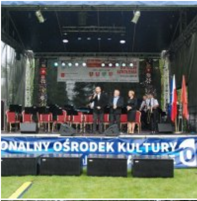
Zator 2016 Citizenship knowledge and fun