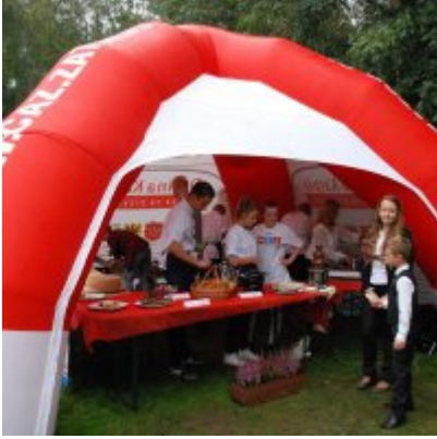
Zator 2016 Citizenship knowledge and fun