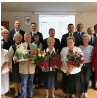
Zasłużony dla Ziemi Oświęcimskiej” dla Towarzystwa Miłośników Ziemi Zatorskiej