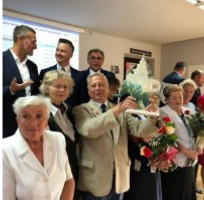
Zasłużony dla Ziemi Oświęcimskiej” dla Towarzystwa Miłośników Ziemi Zatorskiej