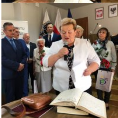
Zasłużony dla Ziemi Oświęcimskiej” dla Towarzystwa Miłośników Ziemi Zatorskiej