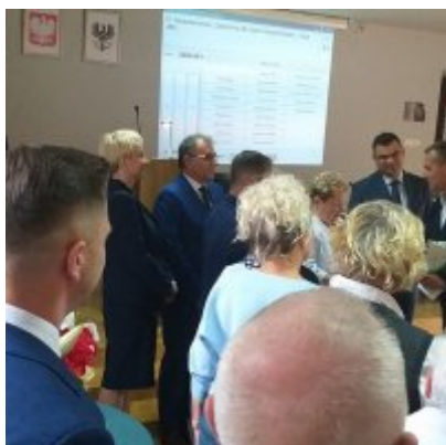
Zasłużony dla Ziemi Oświęcimskiej” dla Towarzystwa Miłośników Ziemi Zatorskiej