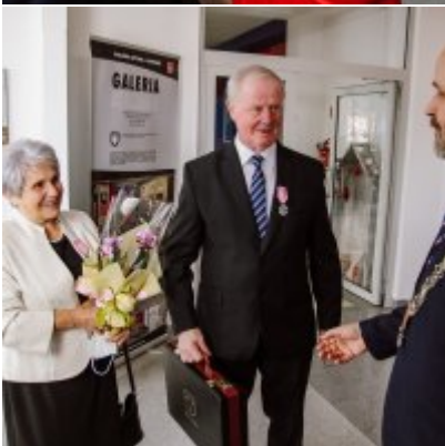
Złote Gody 2021.