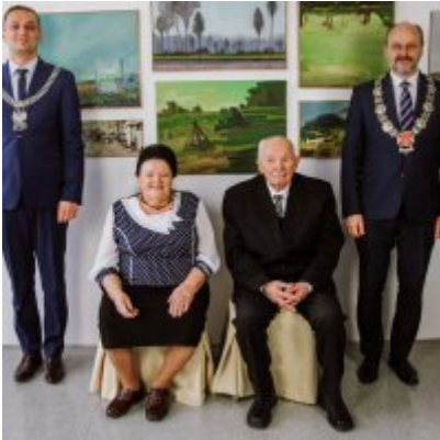
Złote Gody 2021.