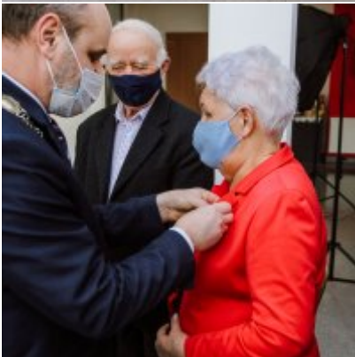
Złote Gody 2021.