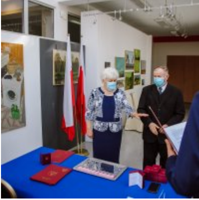
Złote Gody 2021.