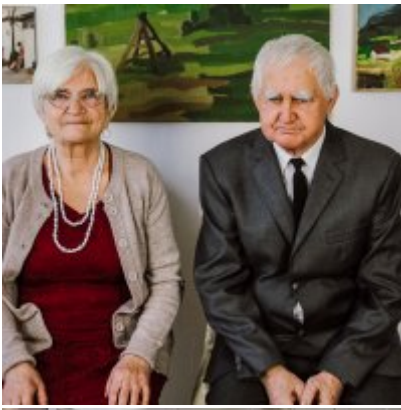
Złote Gody 2021.