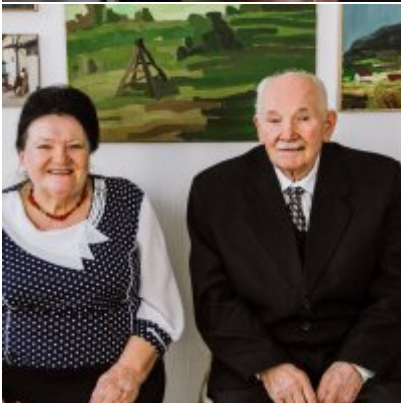
Złote Gody 2021.