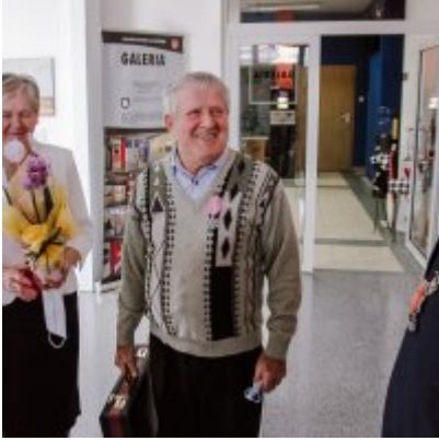
Złote Gody 2021.