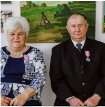
Złote Gody 2021.