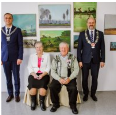
Złote Gody 2021