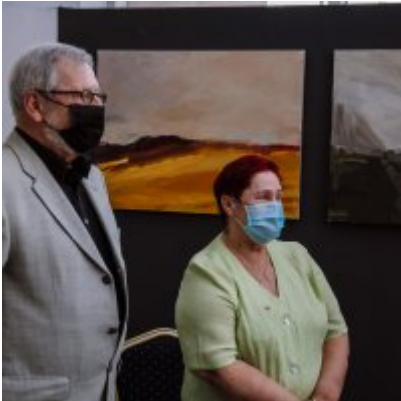
Złote Gody 2021.