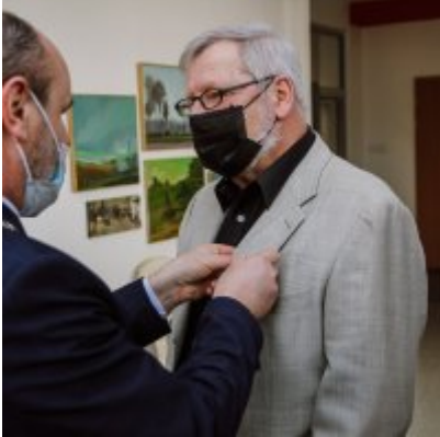
Złote Gody 2021.