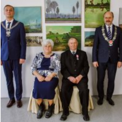
Złote Gody 2021.