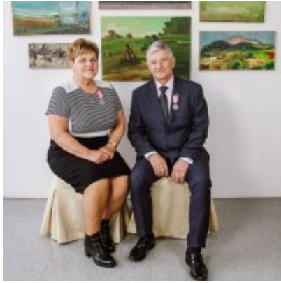
Złote Gody 2021.