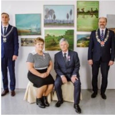
Złote Gody 2021.