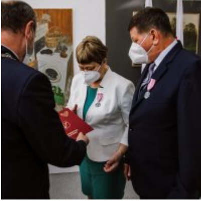
Złote Gody 2021.