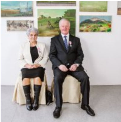
Złote Gody 2021.