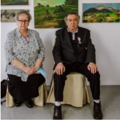
Złote Gody 2021.