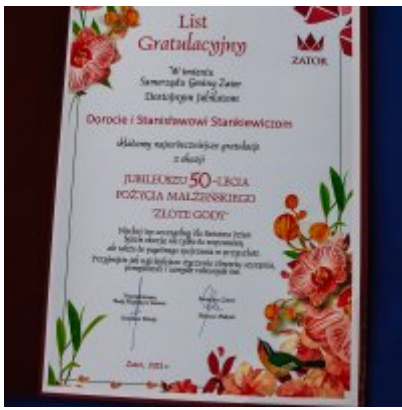
Złote Gody 2021.