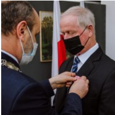
Złote Gody 2021.