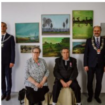
Złote Gody 2021.