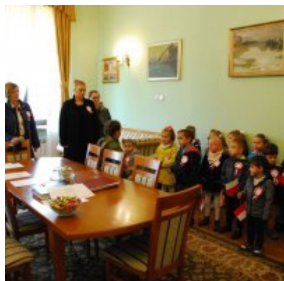
Obchody 100 rocznicy odzyskania przez Polskę Niepodległości w Gminie Zator