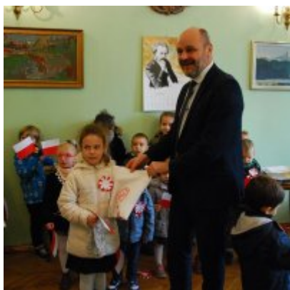
Obchody 100 rocznicy odzyskania przez Polskę Niepodległości w Gminie Zator