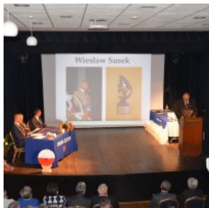
Uroczysta Sesja Rady Miejskiej w Zatorze 11 listopada 2018.