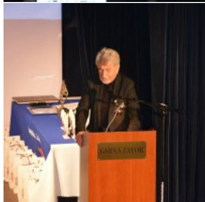
Uroczysta Sesja Rady Miejskiej w Zatorze 11 listopada 2018.