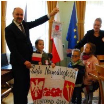
Obchody 100 rocznicy odzyskania przez Polskę Niepodległości w Gminie Zator