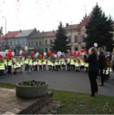
Obchody 100 rocznicy odzyskania przez Polskę Niepodległości w Gminie Zator