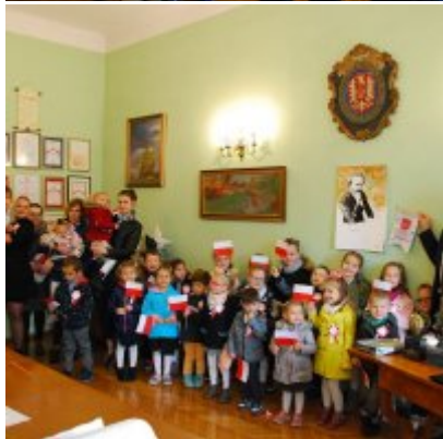
Obchody 100 rocznicy odzyskania przez Polskę Niepodległości w Gminie Zator