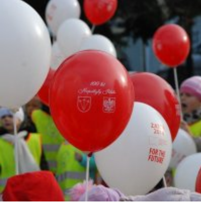
Obchody 100 rocznicy odzyskania przez Polskę Niepodległości w Gminie Zator