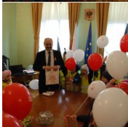
Obchody 100 rocznicy odzyskania przez Polskę Niepodległości w Gminie Zator