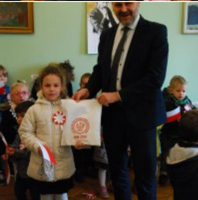
Obchody 100 rocznicy odzyskania przez Polskę Niepodległości w Gminie Zator