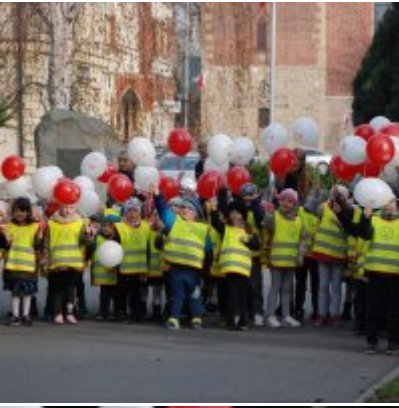
Obchody 100 rocznicy odzyskania przez Polskę Niepodległości w Gminie Zator