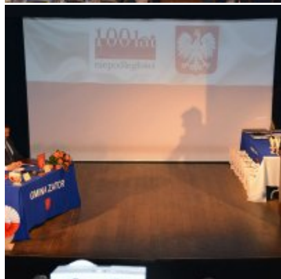
Uroczysta Sesja Rady Miejskiej w Zatorze 11 listopada 2018.