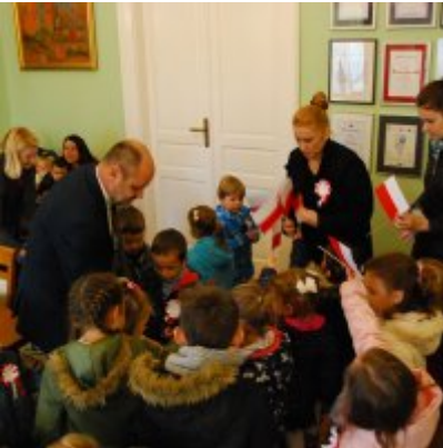
Obchody 100 rocznicy odzyskania przez Polskę Niepodległości w Gminie Zator