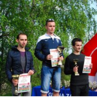
Obchody święta 3 Maja 2016.