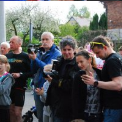
Obchody święta 3 Maja 2016.