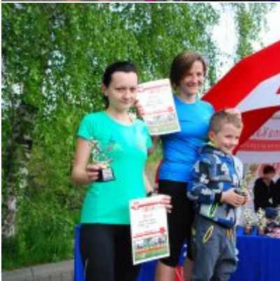
Obchody święta 3 Maja 2016.