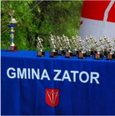
Obchody święta 3 Maja 2016.