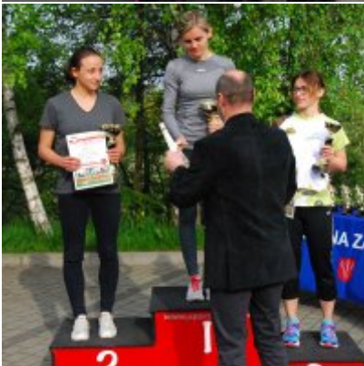
Obchody święta 3 Maja 2016.