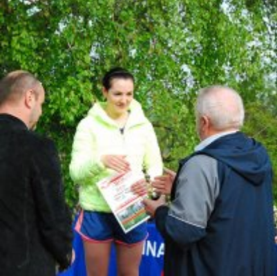
Obchody święta 3 Maja 2016.