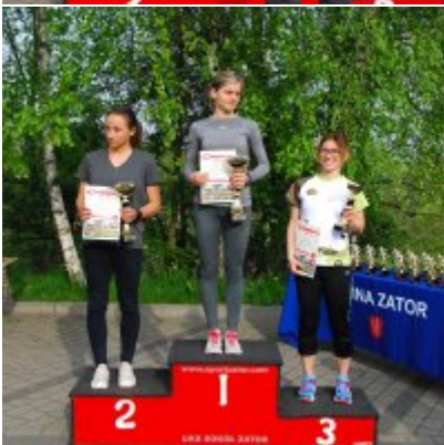
Obchody święta 3 Maja 2016.