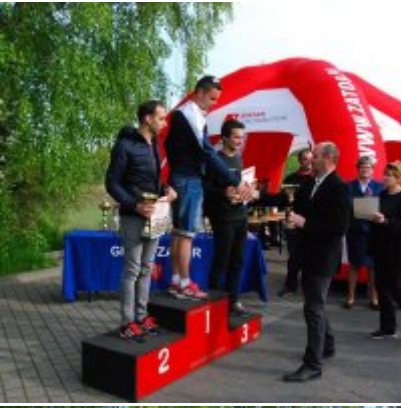
Obchody święta 3 Maja 2016.