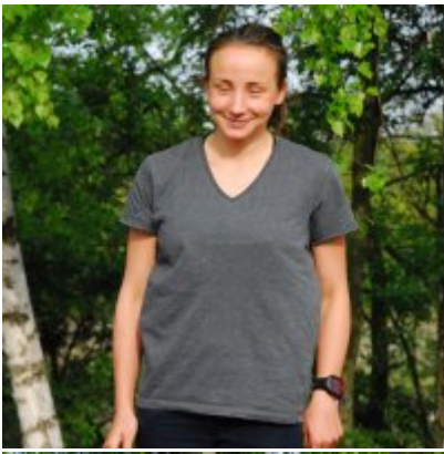
Obchody święta 3 Maja 2016.