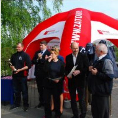
Obchody święta 3 Maja 2016.