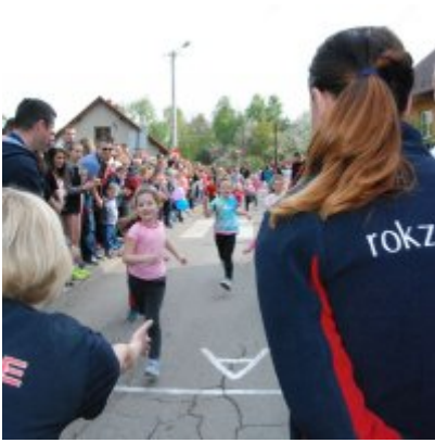
Obchody święta 3 Maja 2016.