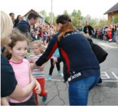
Obchody święta 3 Maja 2016.