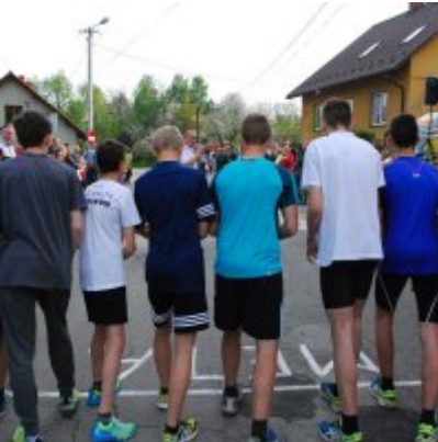
Obchody święta 3 Maja 2016.