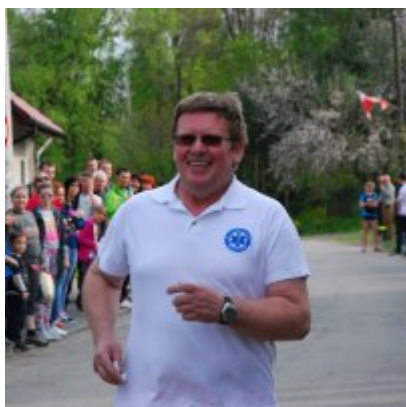
Obchody święta 3 Maja 2016.