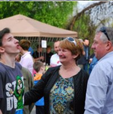
Obchody święta 3 Maja 2016.