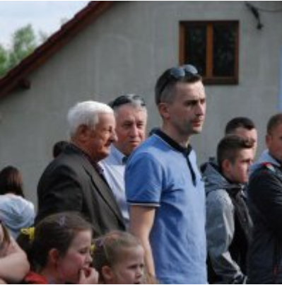
Obchody święta 3 Maja 2016.