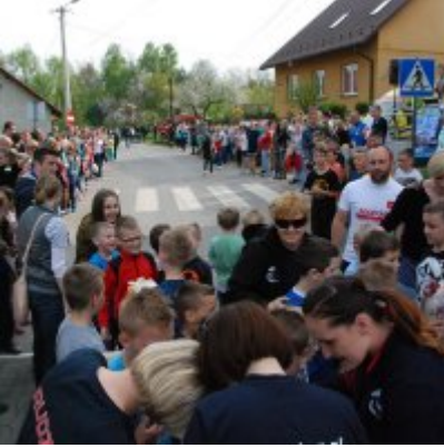
Obchody święta 3 Maja 2016.