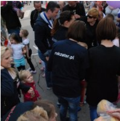
Obchody święta 3 Maja 2016.