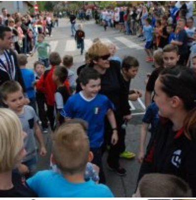
Obchody święta 3 Maja 2016.