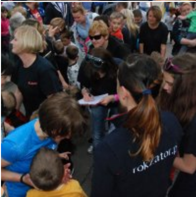
Obchody święta 3 Maja 2016.