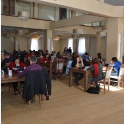
XI Mistrzostwa Doliny Karpia w Scrabble