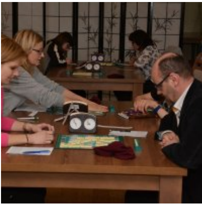
XI Mistrzostwa Doliny Karpia w Scrabble