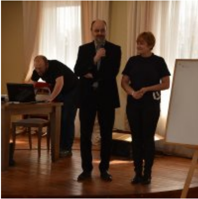
XI Mistrzostwa Doliny Karpia w Scrabble