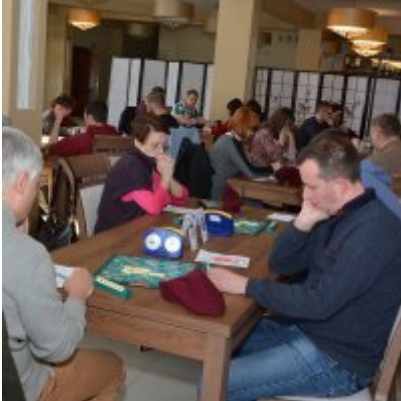
XI Mistrzostwa Doliny Karpia w Scrabble