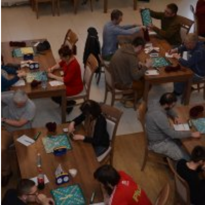
XI Mistrzostwa Doliny Karpia w Scrabble