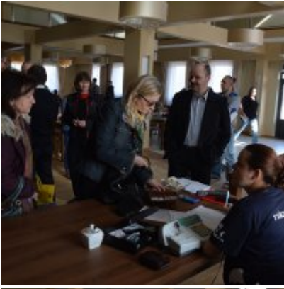
XI Mistrzostwa Doliny Karpia w Scrabble