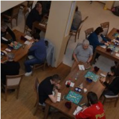
XI Mistrzostwa Doliny Karpia w Scrabble