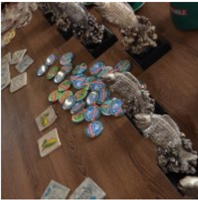
XI Mistrzostwa Doliny Karpia w Scrabble