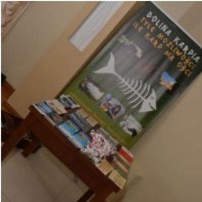
XI Mistrzostwa Doliny Karpia w Scrabble