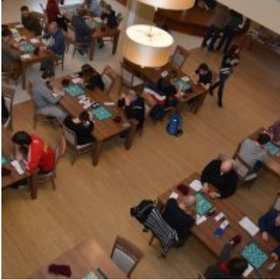
XI Mistrzostwa Doliny Karpia w Scrabble