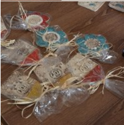
XI Mistrzostwa Doliny Karpia w Scrabble