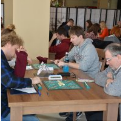
XI Mistrzostwa Doliny Karpia w Scrabble