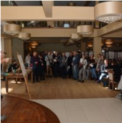
XI Mistrzostwa Doliny Karpia w Scrabble