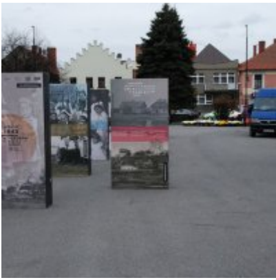
Wystawa „Wołyń 1943 Wołają z grobów, których nie ma” na zatorskim rynku...