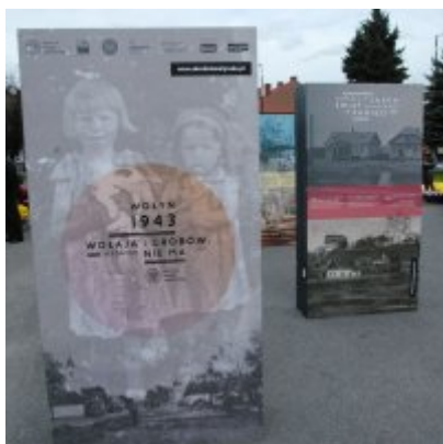
Wystawa „Wołyń 1943 Wołają z grobów, których nie ma” na zatorskim rynku...