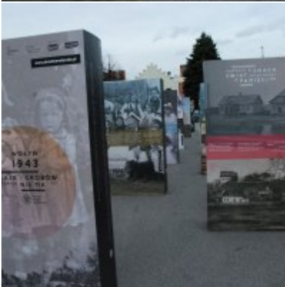
Wystawa „Wołyń 1943 Wołają z grobów, których nie ma” na zatorskim rynku...