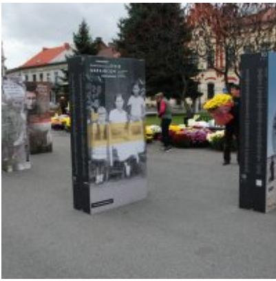
Wystawa „Wołyń 1943 Wołają z grobów, których nie ma” na zatorskim rynku...