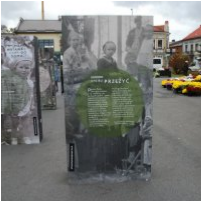
Wystawa „Wołyń 1943 Wołają z grobów, których nie ma” na zatorskim rynku...