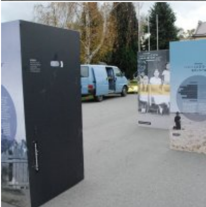
Wystawa „Wołyń 1943 Wołają z grobów, których nie ma” na zatorskim rynku...