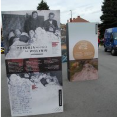
Wystawa „Wołyń 1943 Wołają z grobów, których nie ma” na zatorskim rynku...