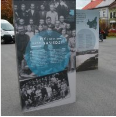
Wystawa „Wołyń 1943 Wołają z grobów, których nie ma” na zatorskim rynku...