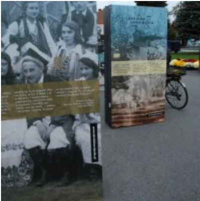
Wystawa „Wołyń 1943 Wołają z grobów, których nie ma” na zatorskim rynku...