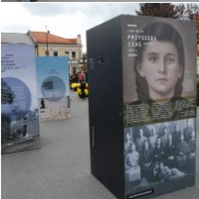
Wystawa „Wołyń 1943 Wołają z grobów, których nie ma” na zatorskim rynku...