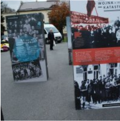
Wystawa „Wołyń 1943 Wołają z grobów, których nie ma” na zatorskim rynku...