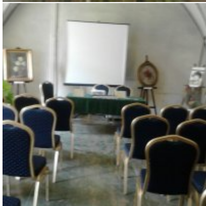
Wystawa Wandy Stiebalowej