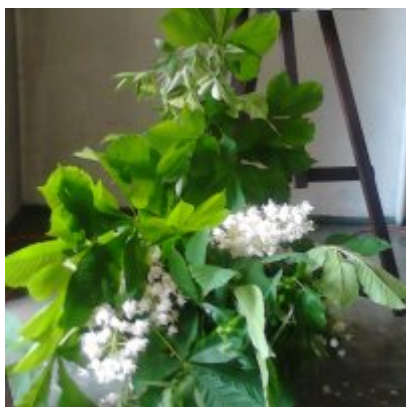
Wystawa Wandy Stiebalowej