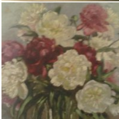
Wystawa Wandy Stiebalowej