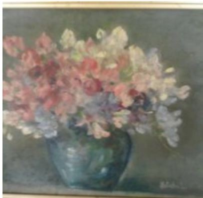
Wystawa Wandy Stiebalowej