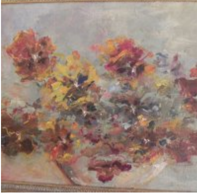
Wystawa Wandy Stiebalowej