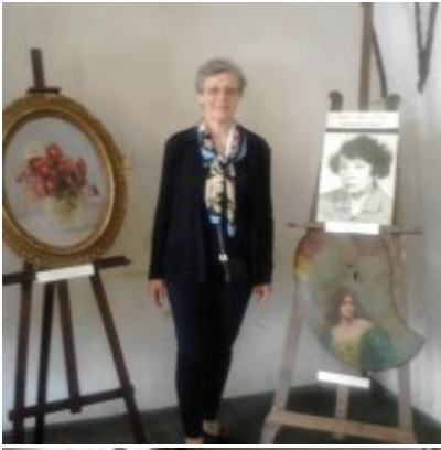
Wystawa Wandy Stiebalowej