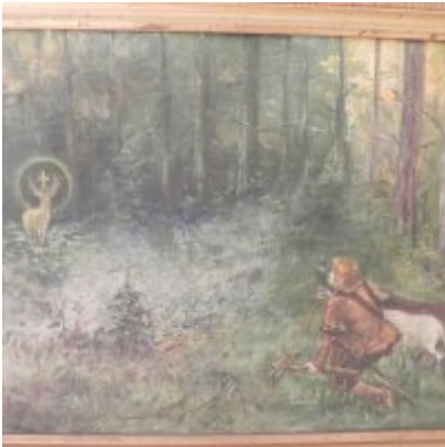
Wystawa Wandy Stiebalowej