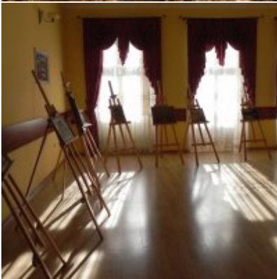
Wystawa Wandy Stiebalowej