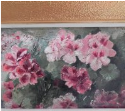
Wystawa Wandy Stiebalowej