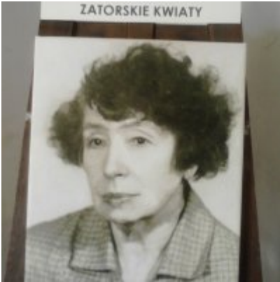
Wystawa Wandy Stiebalowej