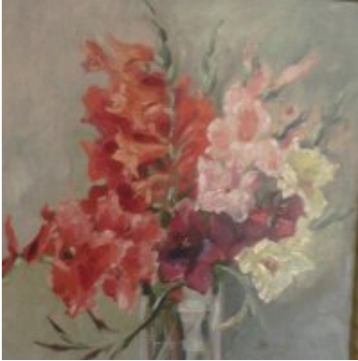
Wystawa Wandy Stiebalowej