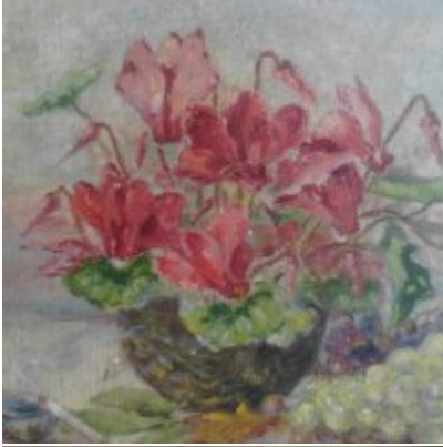
Wystawa Wandy Stiebalowej