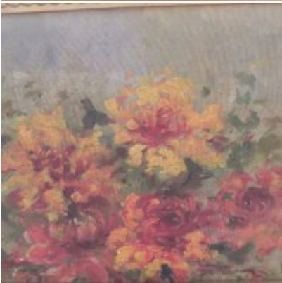
Wystawa Wandy Stiebalowej