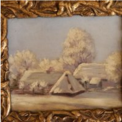
Wystawa Wandy Stiebalowej