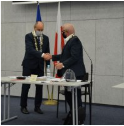
Sesja absolutoryjna 2020