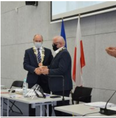
Sesja absolutoryjna 2020