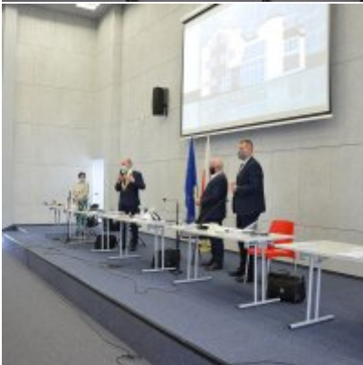
Sesja absolutoryjna 2020