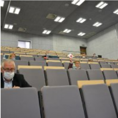
Sesja absolutoryjna 2020