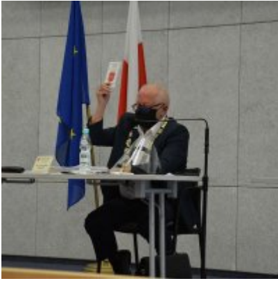
Sesja absolutoryjna 2020