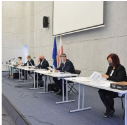
Sesja absolutoryjna 2020