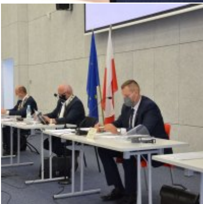
Sesja absolutoryjna 2020