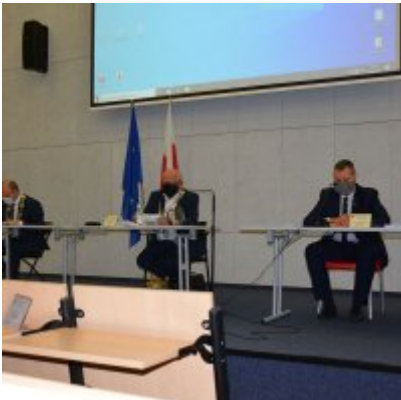
Sesja absolutoryjna 2020