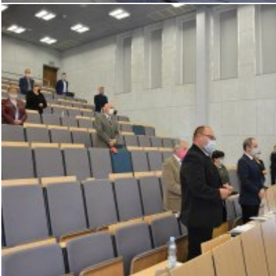
Sesja absolutoryjna 2020