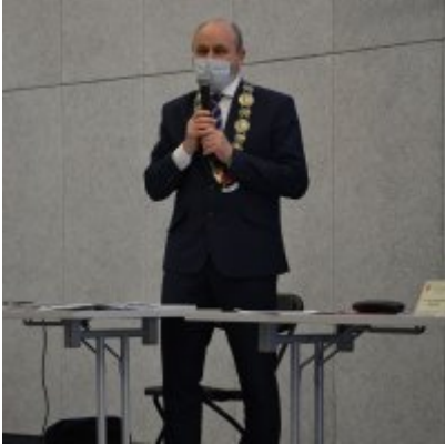
Sesja absolutoryjna 2020