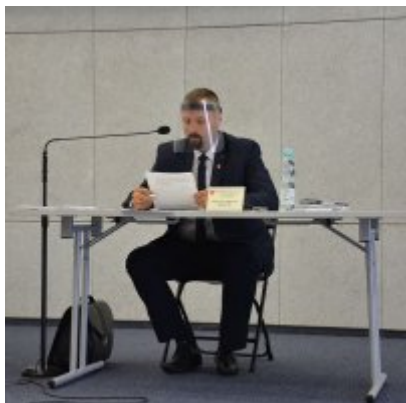
Sesja absolutoryjna 2020