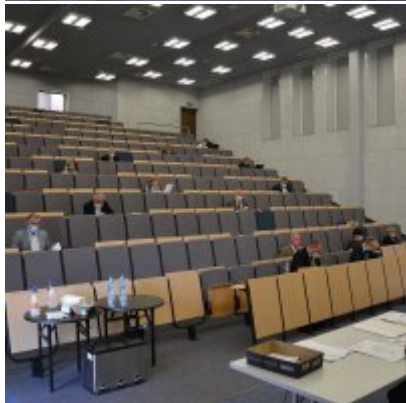
Sesja absolutoryjna 2020