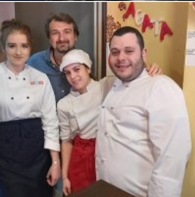
WZS - podsumowanie realizacji praktyk zagranicznych