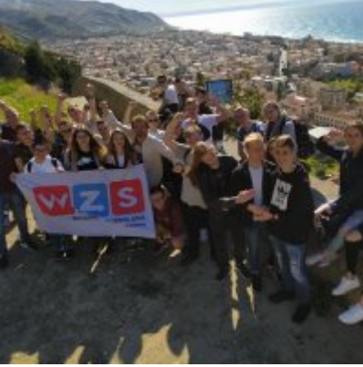
WZS - podsumowanie realizacji praktyk zagranicznych