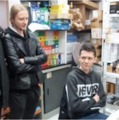
WZS - podsumowanie realizacji praktyk zagranicznych