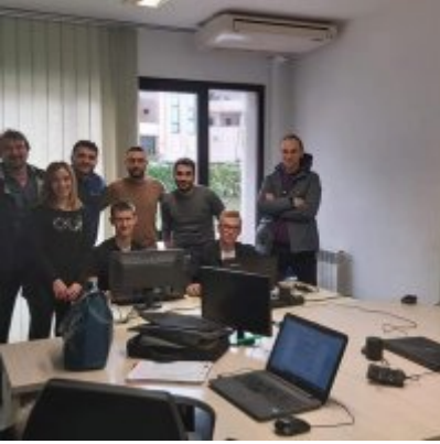
WZS - podsumowanie realizacji praktyk zagranicznych