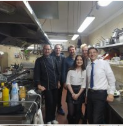
WZS - podsumowanie realizacji praktyk zagranicznych