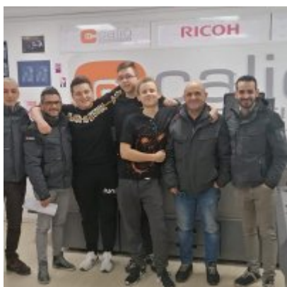
WZS - podsumowanie realizacji praktyk zagranicznych