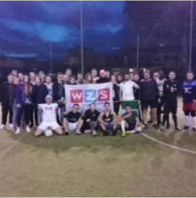
WZS - podsumowanie realizacji praktyk zagranicznych