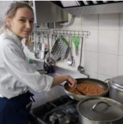
WZS - podsumowanie realizacji praktyk zagranicznych