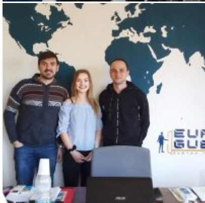
WZS - podsumowanie realizacji praktyk zagranicznych