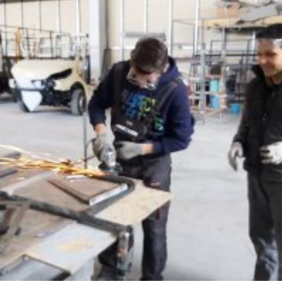
WZS - podsumowanie realizacji praktyk zagranicznych