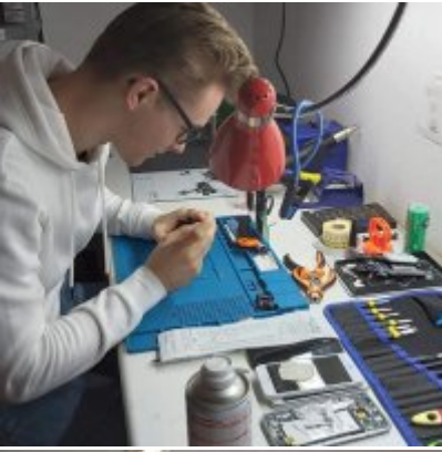
WZS - podsumowanie realizacji praktyk zagranicznych