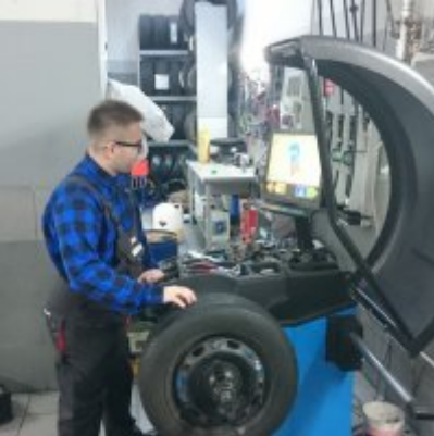
WZS - podsumowanie realizacji praktyk zagranicznych