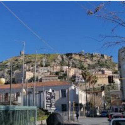
WZS - podsumowanie realizacji praktyk zagranicznych