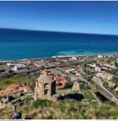
WZS - podsumowanie realizacji praktyk zagranicznych