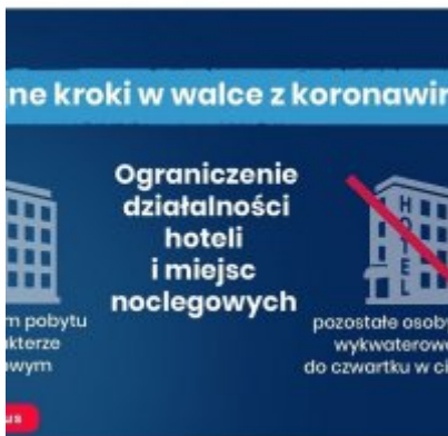
Nowe zasady bezpieczeństwa