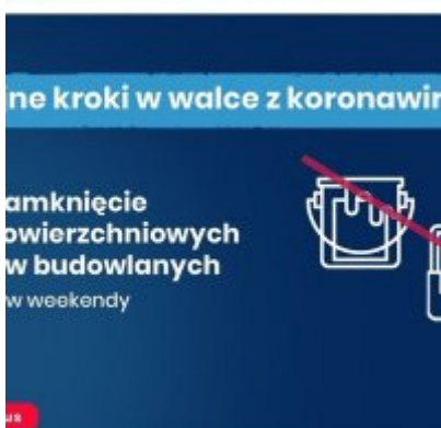
Nowe zasady bezpieczeństwa