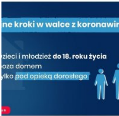
Nowe zasady bezpieczeństwa