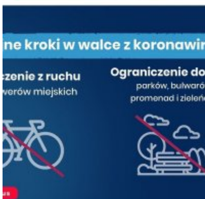
Nowe zasady bezpieczeństwa