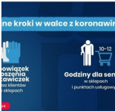
Nowe zasady bezpieczeństwa