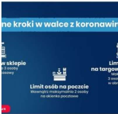
Nowe zasady bezpieczeństwa