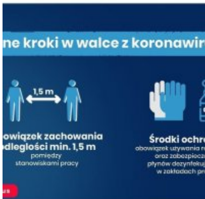
Nowe zasady bezpieczeństwa