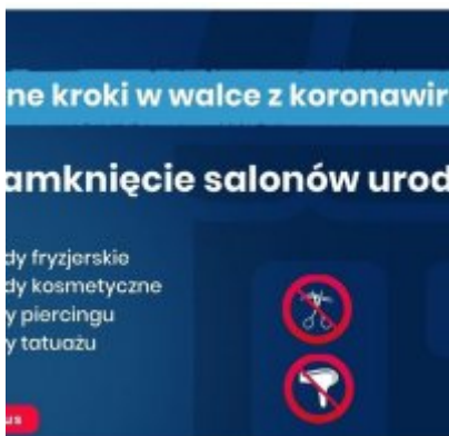
Nowe zasady bezpieczeństwa