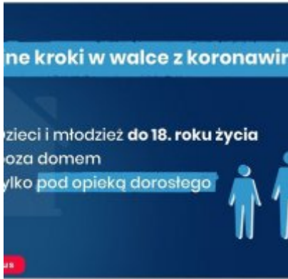
Nowe zasady bezpieczeństwa