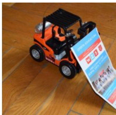
WZS na Targach Edukacyjnych w Brzeźnicy