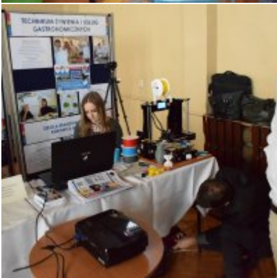
WZS na Targach Edukacyjnych w Brzeźnicy