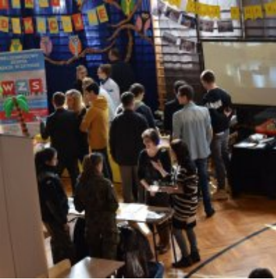
WZS na Targach Edukacyjnych w Brzeźnicy