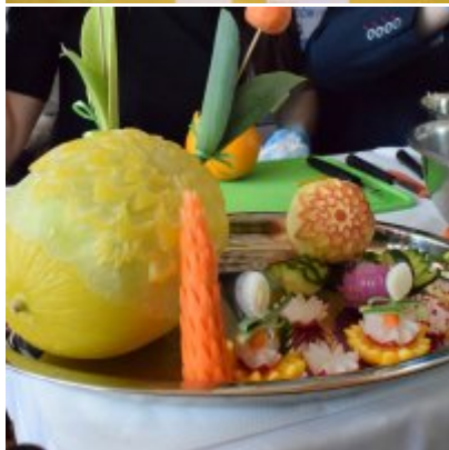
WZS na Targach Edukacyjnych w Brzeźnicy