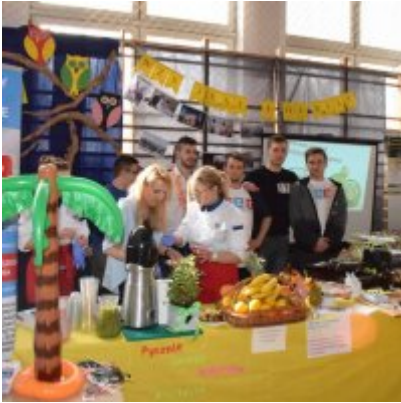
WZS na Targach Edukacyjnych w Brzeźnicy