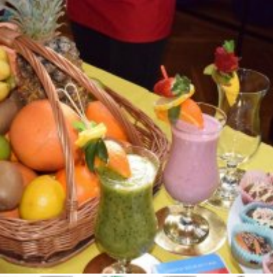
WZS na Targach Edukacyjnych w Brzeźnicy