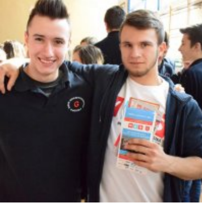
WZS na Targach Edukacyjnych w Brzeźnicy