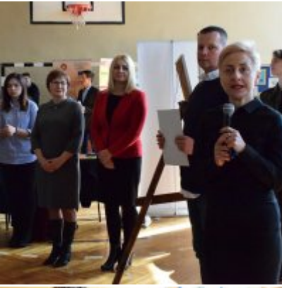
WZS na Targach Edukacyjnych w Brzeźnicy