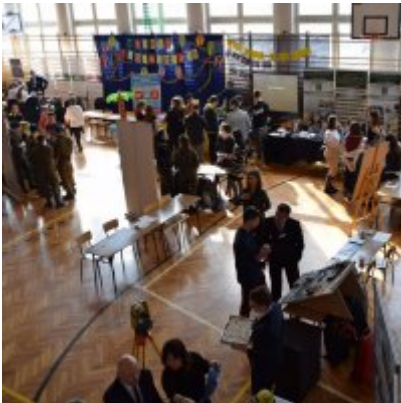
WZS na Targach Edukacyjnych w Brzeźnicy