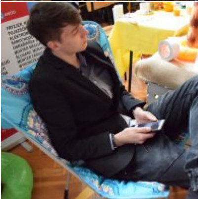
WZS na Targach Edukacyjnych w Brzeźnicy