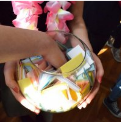
WZS na Targach Edukacyjnych w Brzeźnicy