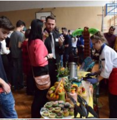
WZS na Targach Edukacyjnych w Brzeźnicy