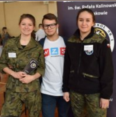
WZS na Targach Edukacyjnych w Brzeźnicy