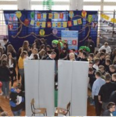
WZS na Targach Edukacyjnych w Brzeźnicy