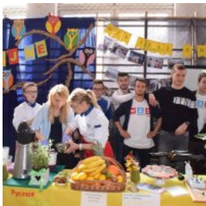
WZS na Targach Edukacyjnych w Brzeźnicy