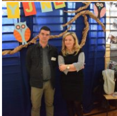
WZS na Targach Edukacyjnych w Brzeźnicy