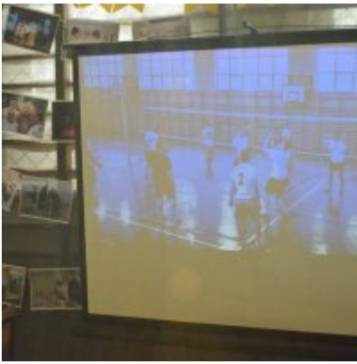
WZS na Targach Edukacyjnych w Brzeźnicy