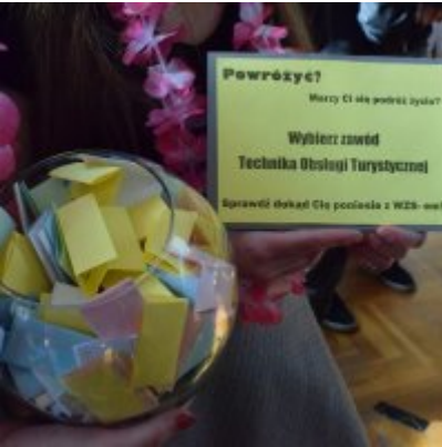
WZS na Targach Edukacyjnych w Brzeźnicy