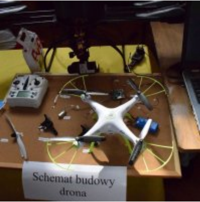
WZS na Targach Edukacyjnych w Brzeźnicy