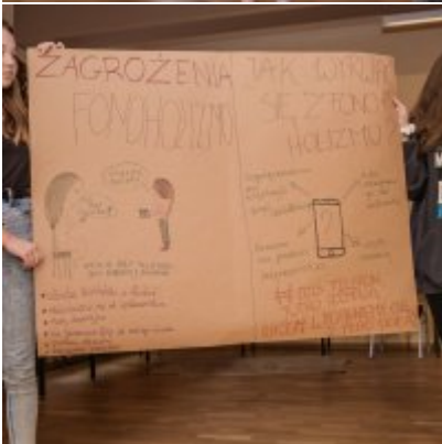
W drodze ku dojrzałości - warsztaty dla młodzieży Gminy Zator