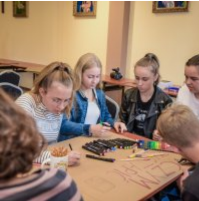
W drodze ku dojrzałości - warsztaty dla młodzieży Gminy Zator