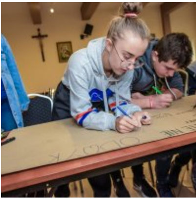
W drodze ku dojrzałości - warsztaty dla młodzieży Gminy Zator