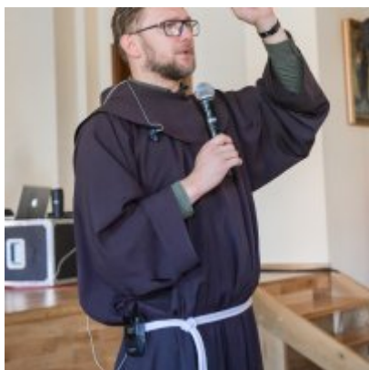
W drodze ku dojrzałości - warsztaty dla młodzieży Gminy Zator