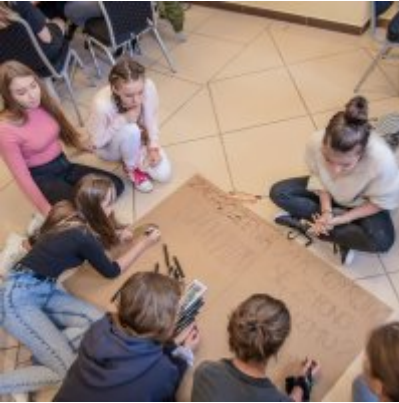
W drodze ku dojrzałości - warsztaty dla młodzieży Gminy Zator