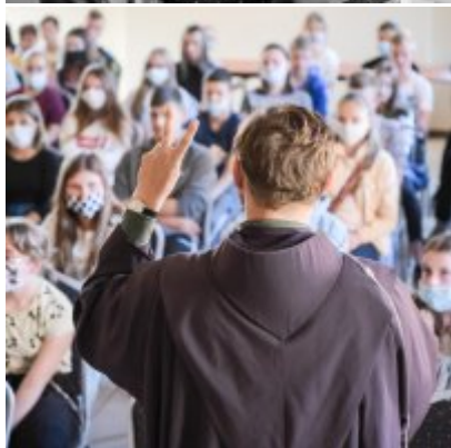
W drodze ku dojrzałości - warsztaty dla młodzieży Gminy Zator