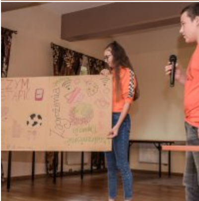
W drodze ku dojrzałości - warsztaty dla młodzieży Gminy Zator