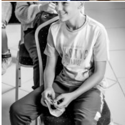
W drodze ku dojrzałości - warsztaty dla młodzieży Gminy Zator