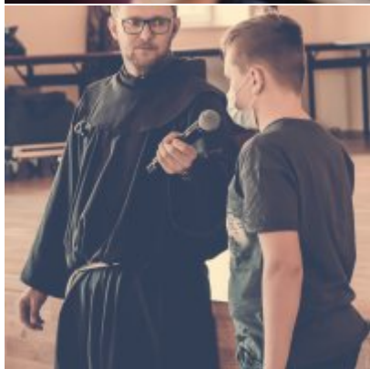
W drodze ku dojrzałości - warsztaty dla młodzieży Gminy Zator