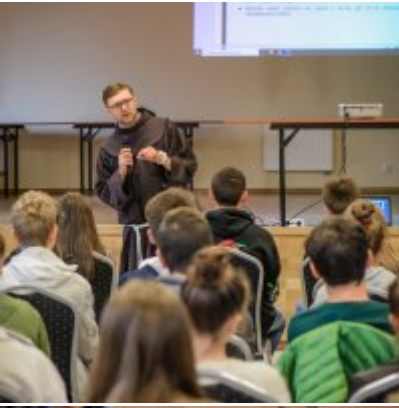
W drodze ku dojrzałości - warsztaty dla młodzieży Gminy Zator