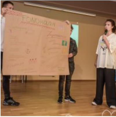
W drodze ku dojrzałości - warsztaty dla młodzieży Gminy Zator