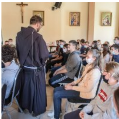
W drodze ku dojrzałości - warsztaty dla młodzieży Gminy Zator