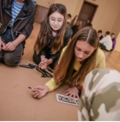
W drodze ku dojrzałości - warsztaty dla młodzieży Gminy Zator