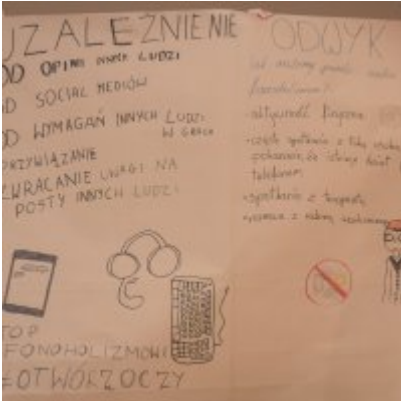
W drodze ku dojrzałości - warsztaty dla młodzieży Gminy Zator