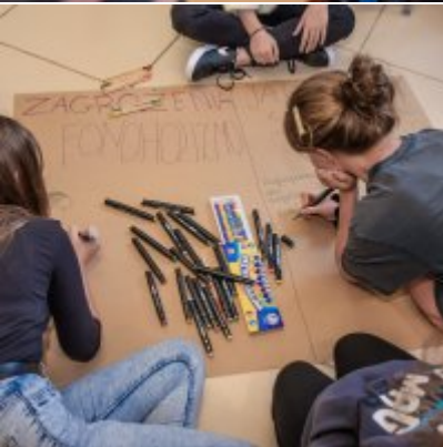
W drodze ku dojrzałości - warsztaty dla młodzieży Gminy Zator