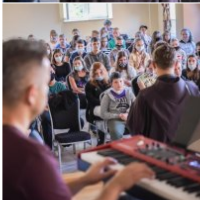
W drodze ku dojrzałości - warsztaty dla młodzieży Gminy Zator