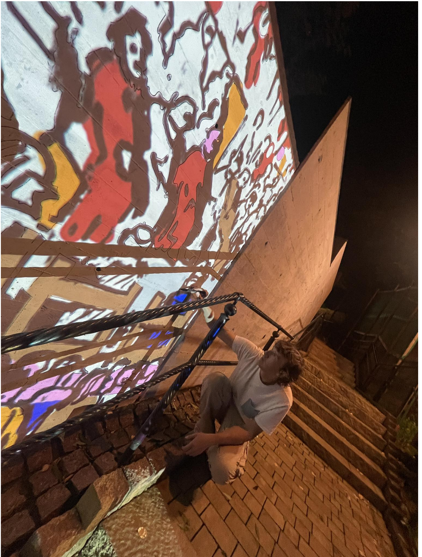
Zadanie zrealizowano przy wsparciu finansowym Województwa Małopolskiego