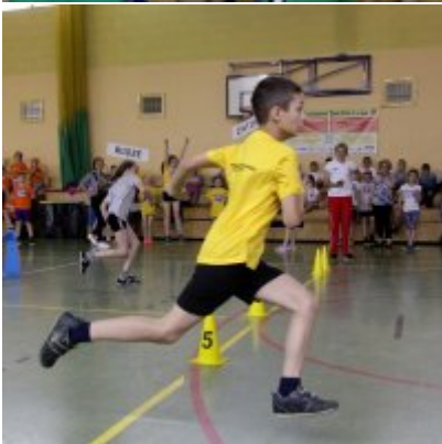
V Igrzyska Olimpijskie klas I-III Gminy Zator