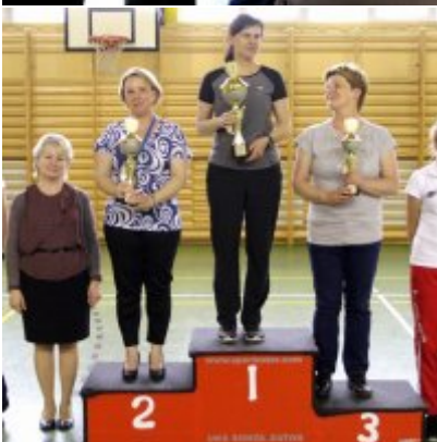
V Igrzyska Olimpijskie klas I-III Gminy Zator