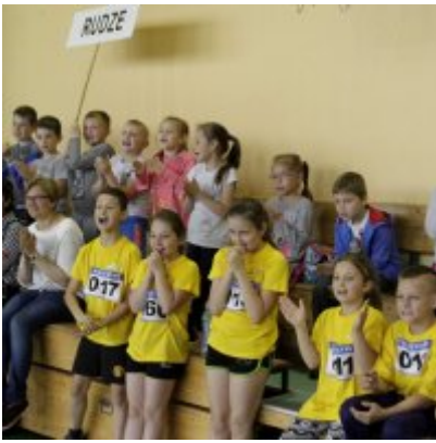
V Igrzyska Olimpijskie klas I-III Gminy Zator