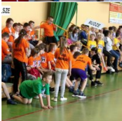
V Igrzyska Olimpijskie klas I-III Gminy Zator