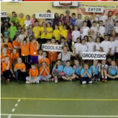
V Igrzyska Olimpijskie klas I-III Gminy Zator