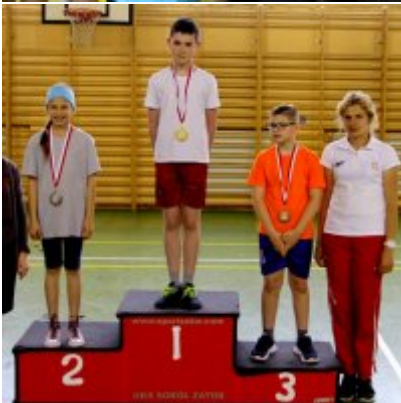
V Igrzyska Olimpijskie klas I-III Gminy Zator