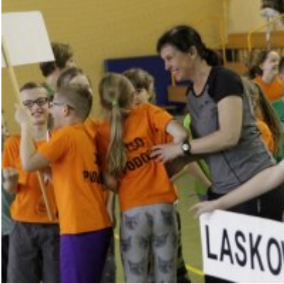
V Igrzyska Olimpijskie klas I-III Gminy Zator