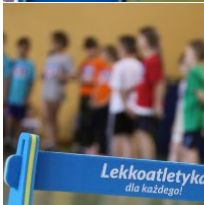
V Igrzyska Olimpijskie klas I-III Gminy Zator