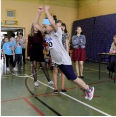
V Igrzyska Olimpijskie klas I-III Gminy Zator