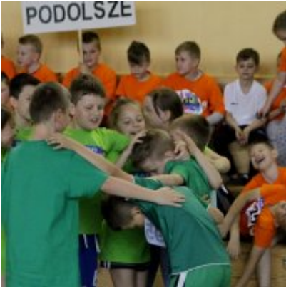
V Igrzyska Olimpijskie klas I-III Gminy Zator