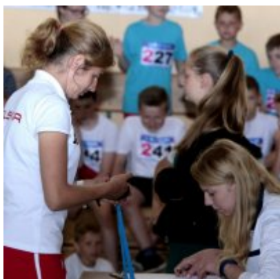
V Igrzyska Olimpijskie klas I-III Gminy Zator