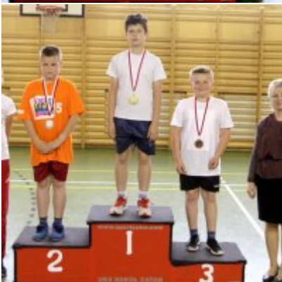
V Igrzyska Olimpijskie klas I-III Gminy Zator