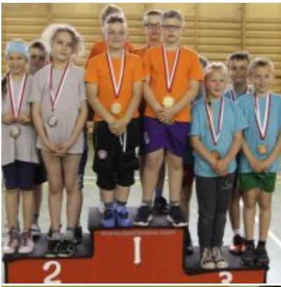
V Igrzyska Olimpijskie klas I-III Gminy Zator