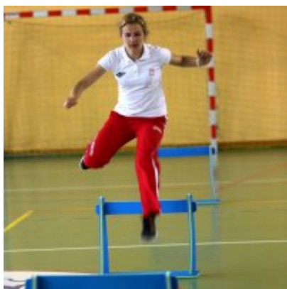
V Igrzyska Olimpijskie klas I-III Gminy Zator