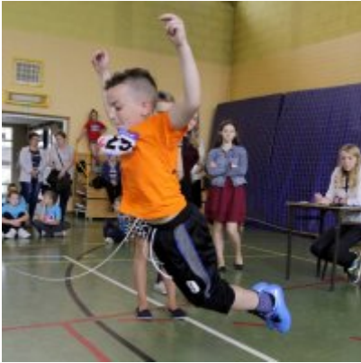
V Igrzyska Olimpijskie klas I-III Gminy Zator