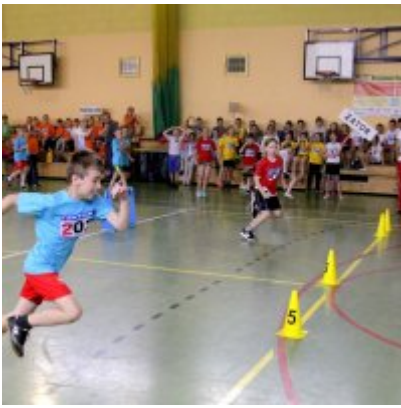
V Igrzyska Olimpijskie klas I-III Gminy Zator