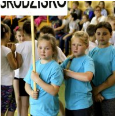
V Igrzyska Olimpijskie klas I-III Gminy Zator