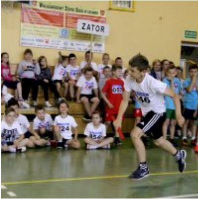
V Igrzyska Olimpijskie klas I-III Gminy Zator