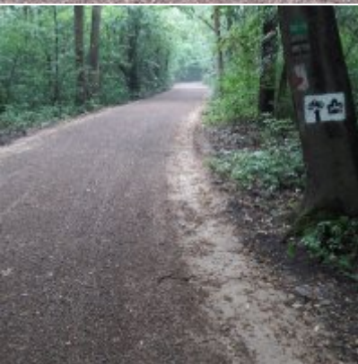
Szlak rowerowy od zamku w Zatorze do zamku w Graboszycach