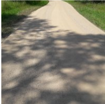
Szlak rowerowy od zamku w Zatorze do zamku w Graboszycach