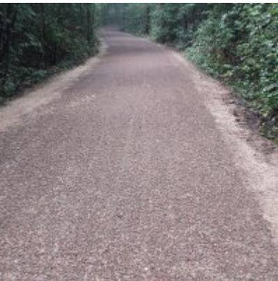
Szlak rowerowy od zamku w Zatorze do zamku w Graboszycach