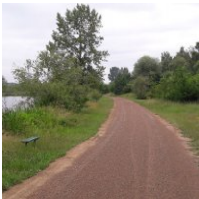
Szlak rowerowy od zamku w Zatorze do zamku w Graboszycach