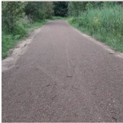
Szlak rowerowy od zamku w Zatorze do zamku w Graboszycach