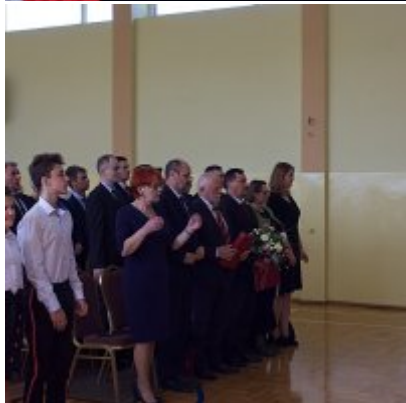
Szkola w Graboszycach ma nowego patrona.