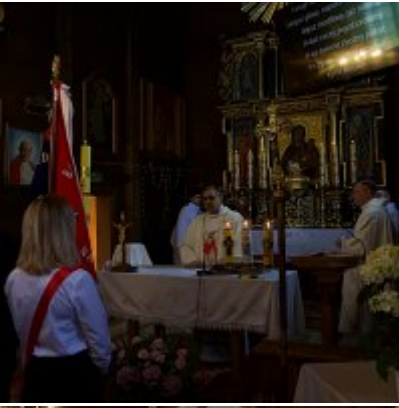
Szkoła w Graboszycach ma nowego patrona.