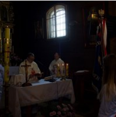
Szkoła w Graboszycach ma nowego patrona.