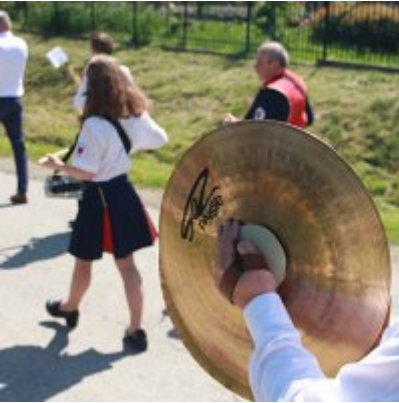
Szkoła w Graboszykach ma nowego patrona.