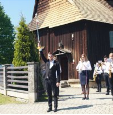
Szkoła w Graboszykach ma nowego patrona.