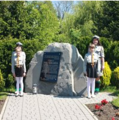
Szkoła w Graboszykach ma nowego patrona.