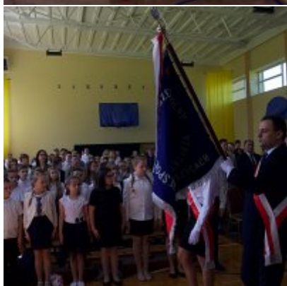
Szkola w Graboszycach ma nowego patrona.