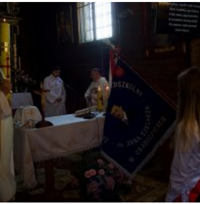
Szkoła w Graboszykach ma nowego patrona.