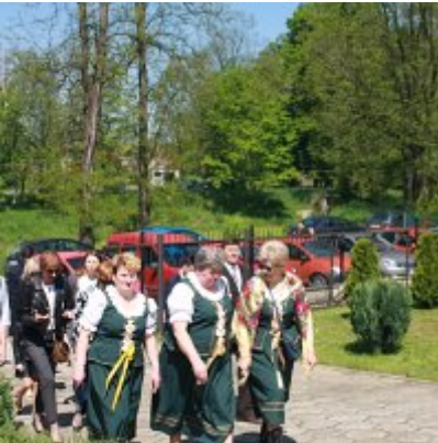
Szkoła w Graboszycach ma nowego patrona.