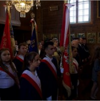
Szkoła w Graboszycach ma nowego patrona.