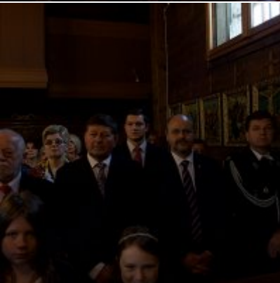
Szkoła w Graboszycach ma nowego patrona.