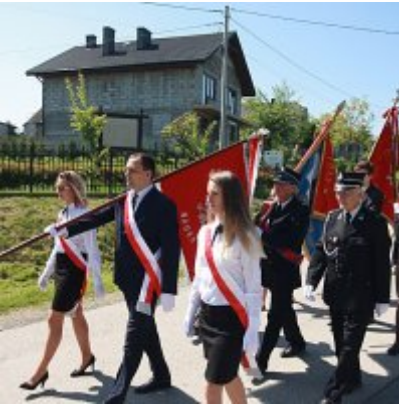
Szkoła w Graboszykach ma nowego patrona.