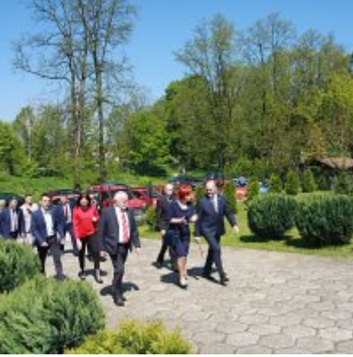
Szkoła w Graboszycach ma nowego patrona.