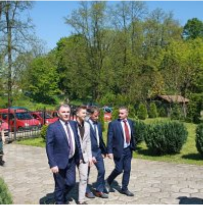
Szkoła w Graboszycach ma nowego patrona.