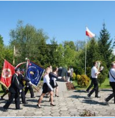
Szkoła w Graboszycach ma nowego patrona.