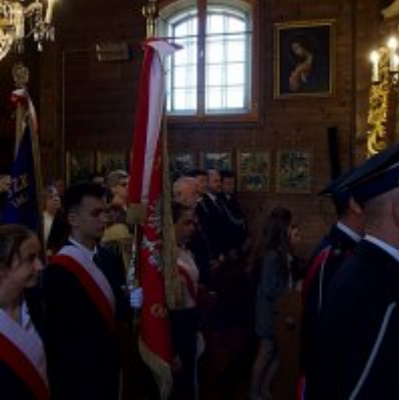
Szkoła w Graboszycach ma nowego patrona.