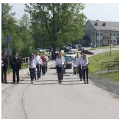
Szkola w Graboszycach ma nowego patrona