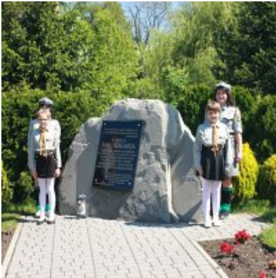
Szkoła w Graboszycach ma nowego patrona.