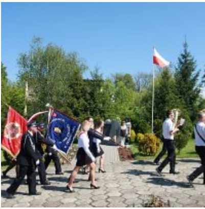
Szkoła w Graboszycach ma nowego patrona.