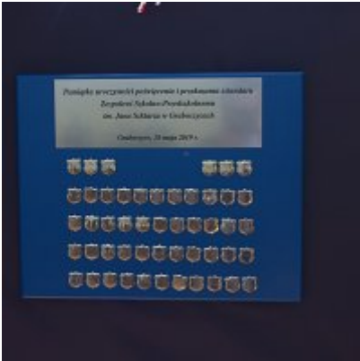
Szkoła w Graboszycach ma nowego patrona.