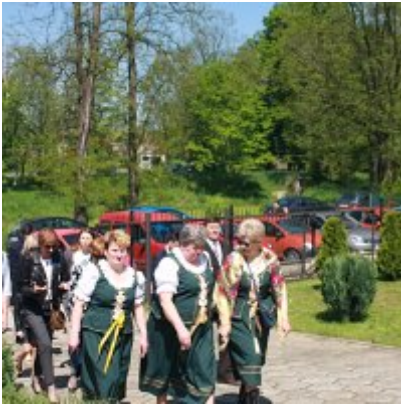
Szkoła w Graboszycach ma nowego patrona.