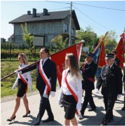
Szkoła w Graboszycach ma nowego patrona.