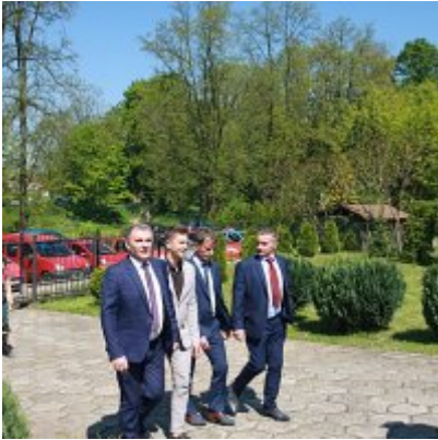
Szkoła w Graboszycach ma nowego patrona.