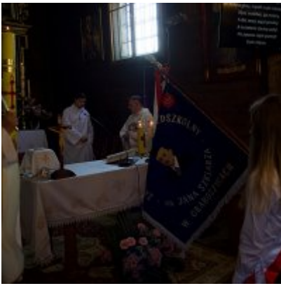
Szkoła w Graboszycach ma nowego patrona.