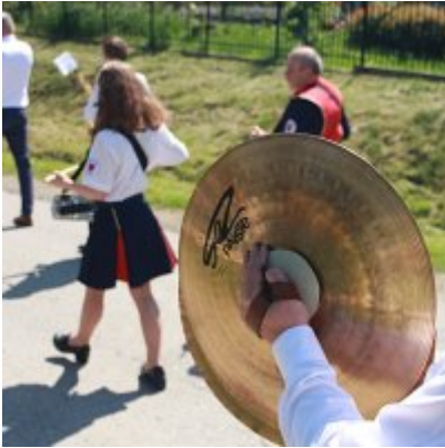
Szkoła w Graboszycach ma nowego patrona.