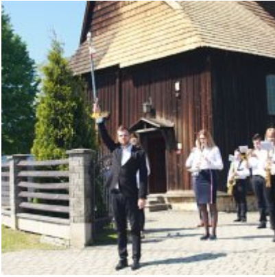
Szkoła w Graboszycach ma nowego patrona.