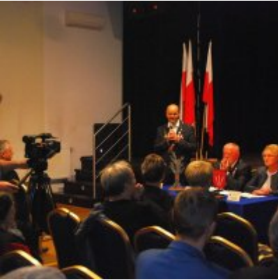
Uroczyste obchody Święta Niepodległości