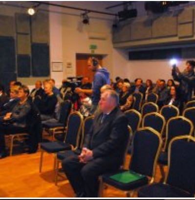
Uroczyste obchody Święta Niepodległości