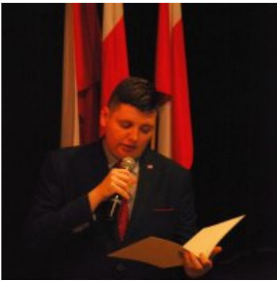
Uroczyste obchody Święta Niepodległości