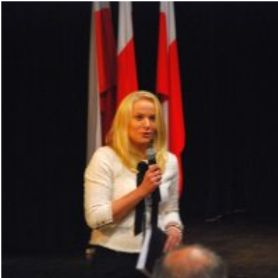
Uroczyste obchody Święta Niepodległości