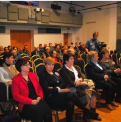
Uroczyste obchody Święta Niepodległości