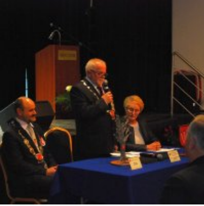
Uroczyste obchody Święta Niepodległości