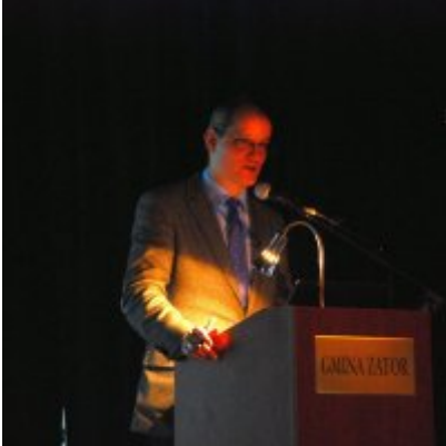
Uroczyste obchody Święta Niepodległości