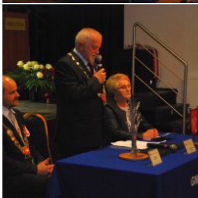
Uroczyste obchody Święta Niepodległości