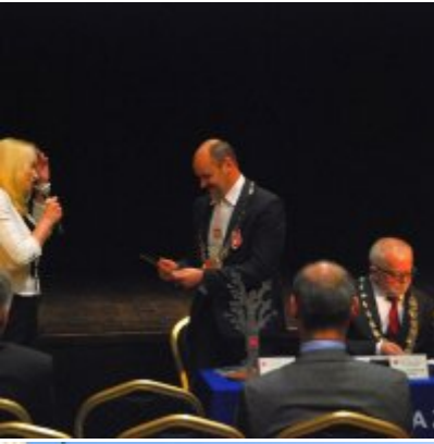
Uroczyste obchody Święta Niepodległości