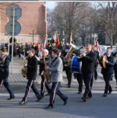
Uroczyste obchody Święta Niepodległości