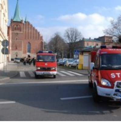
Uroczyste obchody Święta Niepodległości