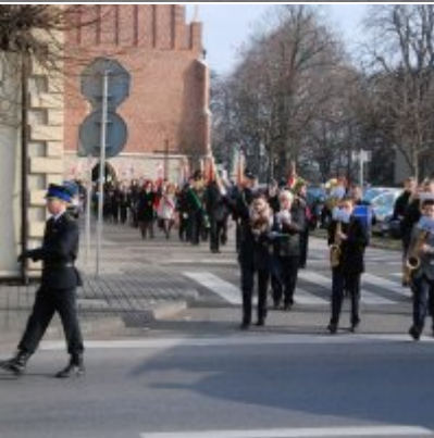
Uroczyste obchody Święta Niepodległości