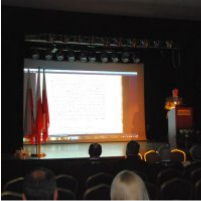
Uroczyste obchody Święta Niepodległości