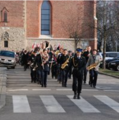
Uroczyste obchody Święta Niepodległości