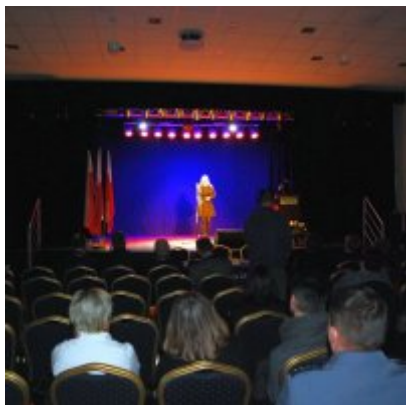
Uroczyste obchody Święta Niepodległości