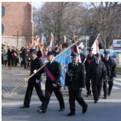
Uroczyste obchody Święta Niepodległości