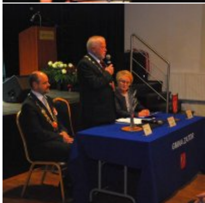
Uroczyste obchody Święta Niepodległości