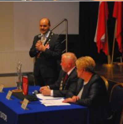
Uroczyste obchody Święta Niepodległości