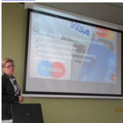
ŚWIATOWY TYDZIEŃ PRZEDSIĘBIORCZOŚCI W WIELOZOWODOWYM ZESPOLE SZKÓŁ W ZATORZE