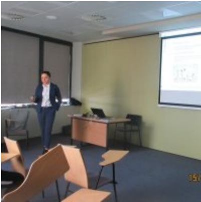
ŚWIATOWY TYDZIEŃ PRZEDSIĘBIORCZOŚCI W WIELOZOWODOWYM ZESPOLE SZKÓŁ W