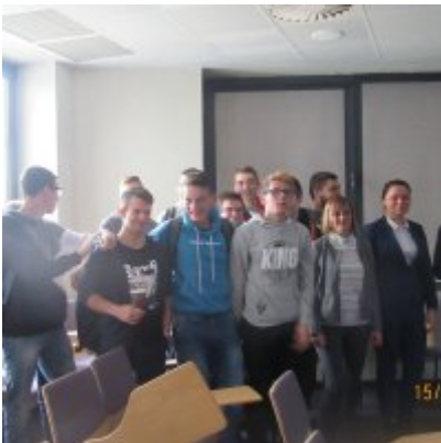
ŚWIATOWY TYDZIEŃ PRZEDSIĘBIORCZOŚCI W WIELOZOWODOWYM ZESPOLE SZKÓŁ W