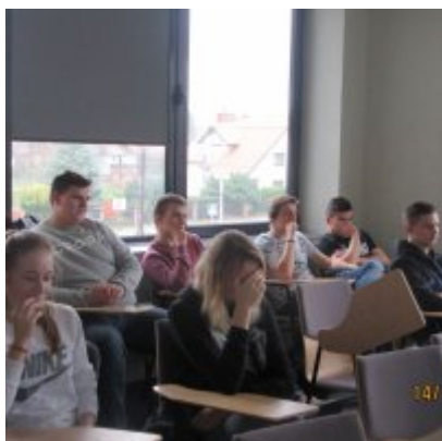
ŚWIATOWY TYDZIEŃ PRZEDSIĘBIORCZOŚCI W WIELOZOWODOWYM ZESPOLE SZKÓŁ W