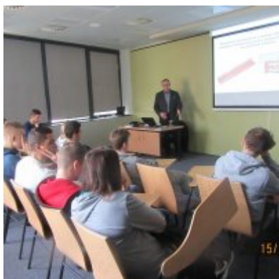
ŚWIATOWY TYDZIEŃ PRZEDSIĘBIORCZOŚCI W WIELOZOWODOWYM ZESPOLE SZKÓŁ W