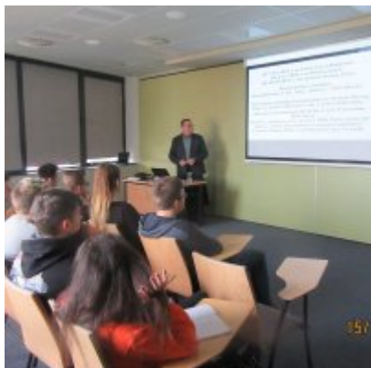
ŚWIATOWY TYDZIEŃ PRZEDSIĘBIORCZOŚCI W WIELOZOWODOWYM ZESPOLE SZKÓŁ W