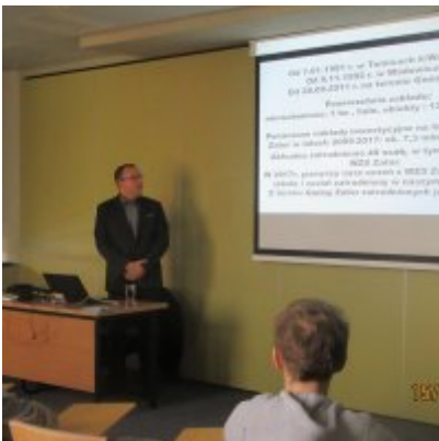
ŚWIATOWY TYDZIEŃ PRZEDSIĘBIORCZOŚCI W WIELOZOWODOWYM ZESPOLE SZKÓŁ W