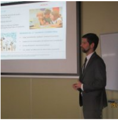
ŚWIATOWY TYDZIEŃ PRZEDSIĘBIORCZOŚCI W WIELOZOWODOWYM ZESPOLE SZKÓŁ W