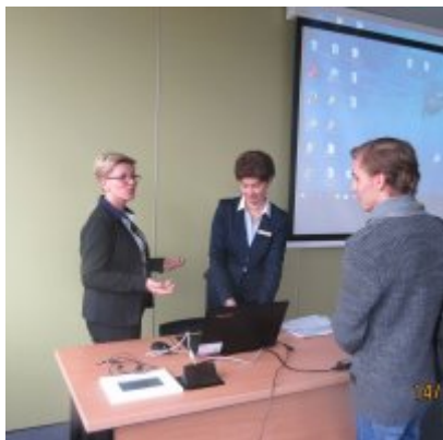
ŚWIATOWY TYDZIEŃ PRZEDSIĘBIORCZOŚCI W WIELOZOWODOWYM ZESPOLE SZKÓŁ W