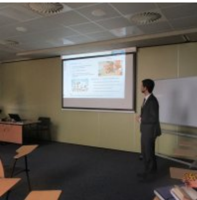
ŚWIATOWY TYDZIEŃ PRZEDSIĘBIORCZOŚCI W WIELOZOWODOWYM ZESPOLE SZKÓŁ W