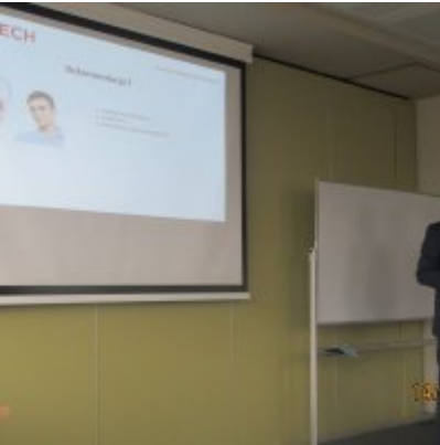
ŚWIATOWY TYDZIEŃ PRZEDSIĘBIORCZOŚCI W WIELOZOWODOWYM ZESPOLE SZKÓŁ W