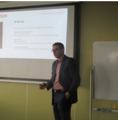
ŚWIATOWY TYDZIEŃ PRZEDSIĘBIORCZOŚCI W WIELOZOWODOWYM ZESPOLE SZKÓŁ W