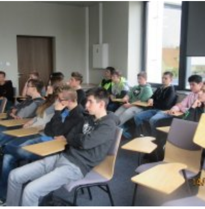
ŚWIATOWY TYDZIEŃ PRZEDSIĘBIORCZOŚCI W WIELOZOWODOWYM ZESPOLE SZKÓŁ W