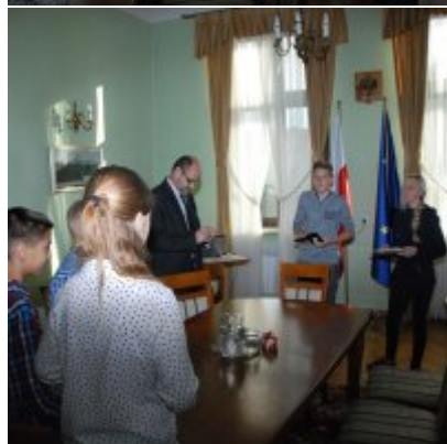
Światowy Dzień Tabliczki Mnożenia w Urzędzie Miejskim w Zatorze