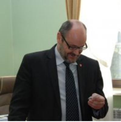
Światowy Dzień Tabliczki Mnożenia w Urzędzie Miejskim w Zatorze