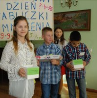
Światowy Dzień Tabliczki Mnożenia w Urzędzie Miejskim w Zatorze