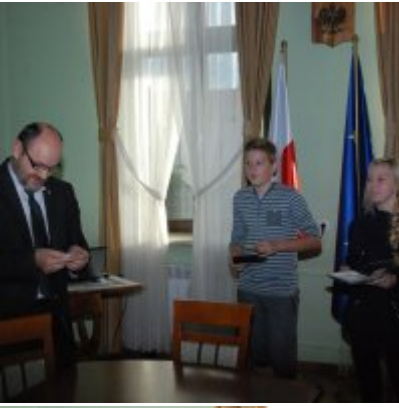
Światowy Dzień Tabliczki Mnożenia w Urzędzie Miejskim w Zatorze