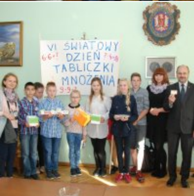
Światowy Dzień Tabliczki Mnożenia w Urzędzie Miejskim w Zatorze