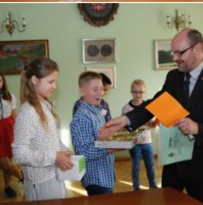
Światowy Dzień Tabliczki Mnożenia w Urzędzie Miejskim w Zatorze