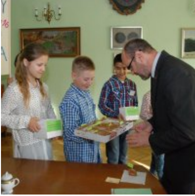
Światowy Dzień Tabliczki Mnożenia w Urzędzie Miejskim w Zatorze