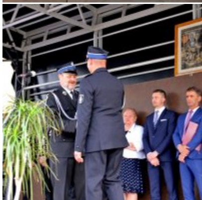
Strażackie święto w Podolszu