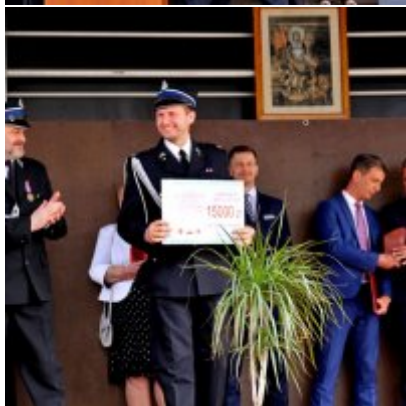
Strażackie święto w Podolszu