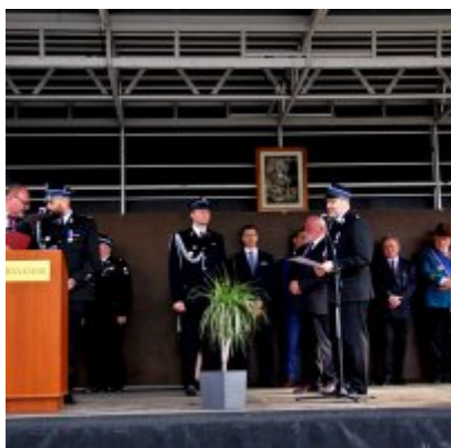
Strażackie święto w Podolszu