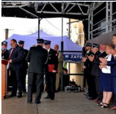
Strażackie święto w Podolszu