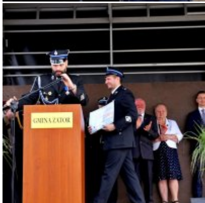
Strażackie święto w Podolszu