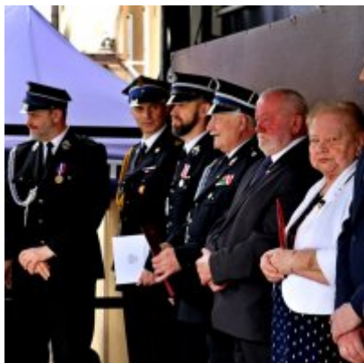
Strażackie święto w Podolszu