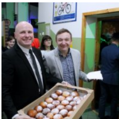
Spotkanie noworoczne w ZSO w Podolszu