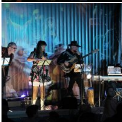
Spotkanie noworoczne w ZSO w Podolszu