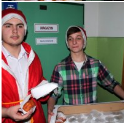
Spotkanie noworoczne w ZSO w Podolszu