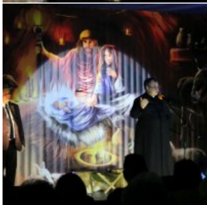
Spotkanie noworoczne w ZSO w Podolszu