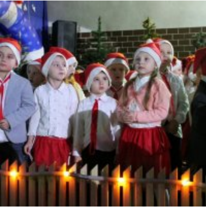
Spotkanie noworoczne w ZSO w Podolszu