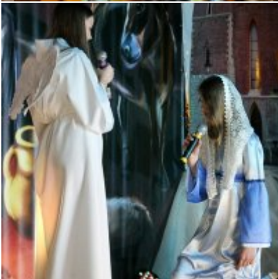
Spotkanie noworoczne w ZSO w Podolszu