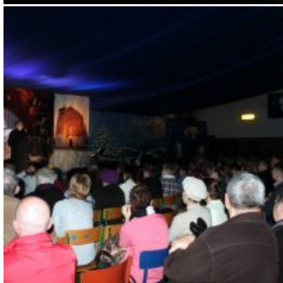
Spotkanie noworoczne w ZSO w Podolszu