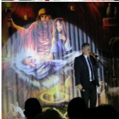
Spotkanie noworoczne w ZSO w Podolszu