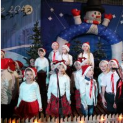
Spotkanie noworoczne w ZSO w Podolszu