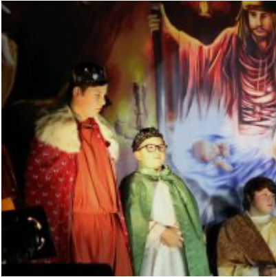
Spotkanie noworoczne w ZSO w Podolszu