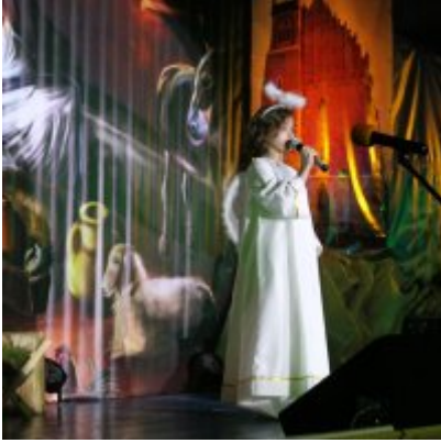
Spotkanie noworoczne w ZSO w Podolszu