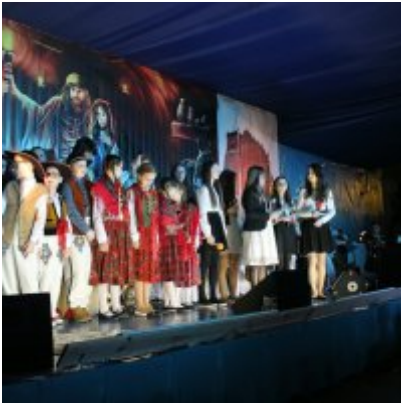
Spotkanie noworoczne w ZSO w Podolszu