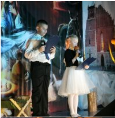
Spotkanie noworoczne w ZSO w Podolszu