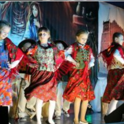
Spotkanie noworoczne w ZSO w Podolszu