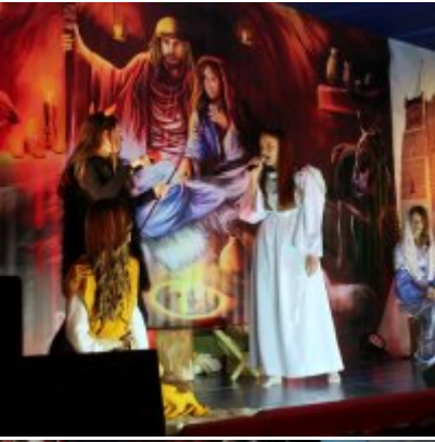
Spotkanie noworoczne w ZSO w Podolszu