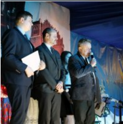
Spotkanie noworoczne w ZSO w Podolszu