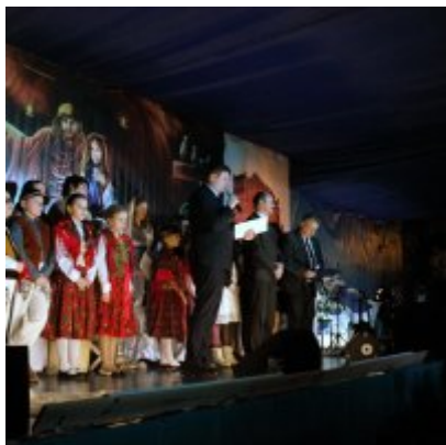
Spotkanie noworoczne w ZSO w Podolszu