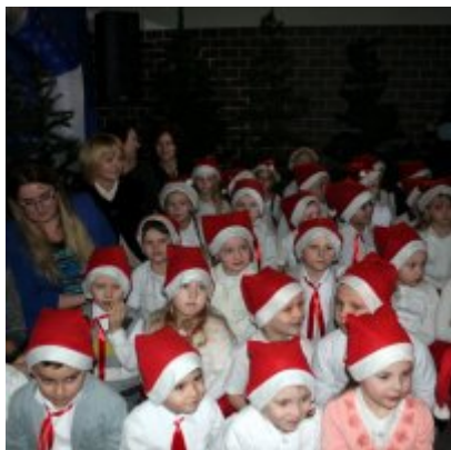
Spotkanie noworoczne w ZSO w Podolszu