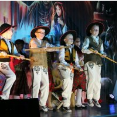
Spotkanie noworoczne w ZSO w Podolszu