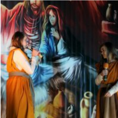
Spotkanie noworoczne w ZSO w Podolszu