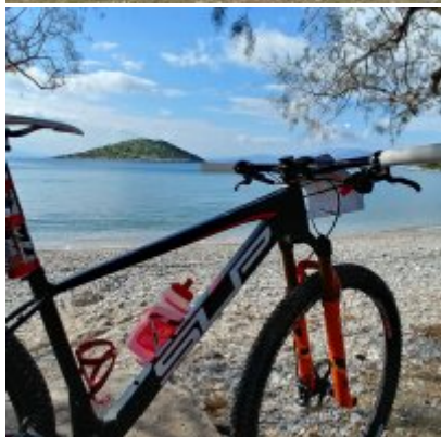
Salamina Epic Races #1 - Gabriela Wojtyła kończy swą pierwszą „etapówkę” w życiu.