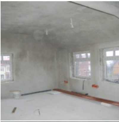
Rozbudowa i remont budynków Urzędu Miejskiego 2008/2010