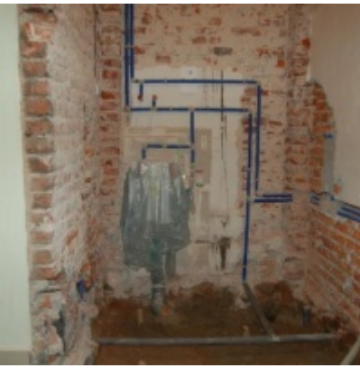
Rozbudowa i remont budynków Urzędu Miejskiego 2008/2010.