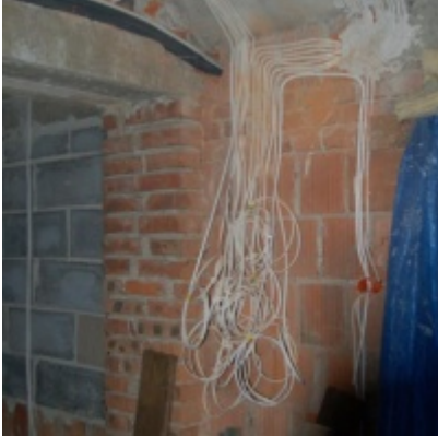
Rozbudowa i remont budynków Urzędu Miejskiego 2008/2010