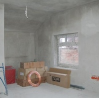
Rozbudowa i remont budynków Urzędu Miejskiego 2008/2010