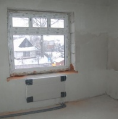
Rozbudowa i remont budynków Urzędu Miejskiego 2008/2010.