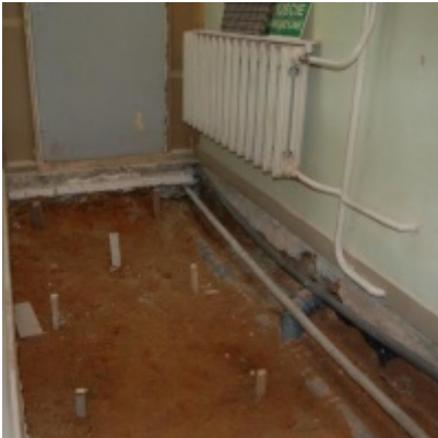
Rozbudowa i remont budynków Urzędu Miejskiego 2008/2010