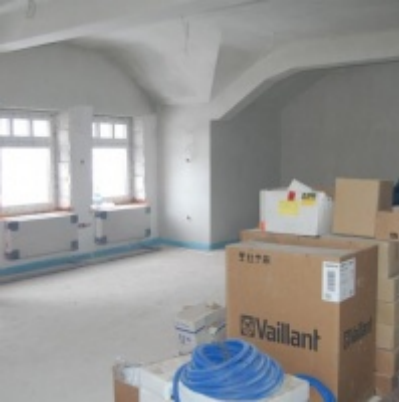
Rozbudowa i remont budynków Urzędu Miejskiego 2008/2010.