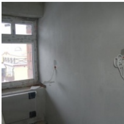
Rozbudowa i remont budynków Urzędu Miejskiego 2008/2010.