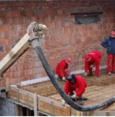
Rozbudowa i remont budynków Urzędu Miejskiego 2008/2010.