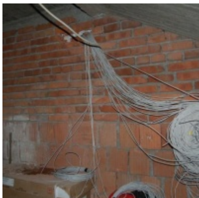
Rozbudowa i remont budynków Urzędu Miejskiego 2008/2010