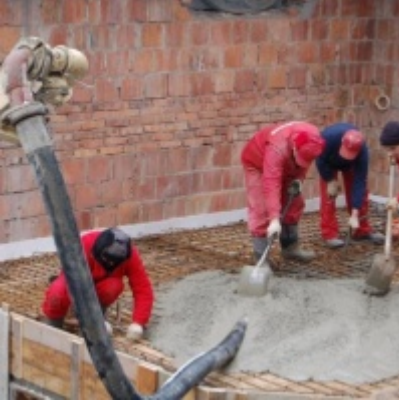
Rozbudowa i remont budynków Urzędu Miejskiego 2008/2010.