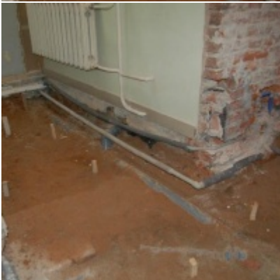
Rozbudowa i remont budynków Urzędu Miejskiego 2008/2010