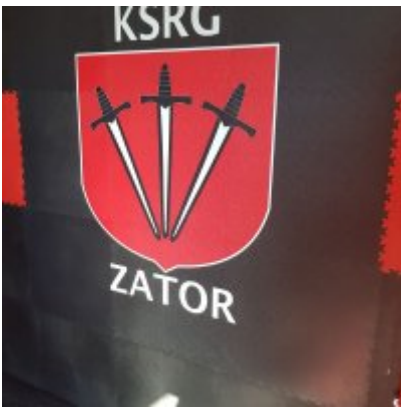
Remont remizy OSP Zator