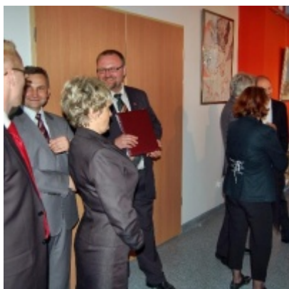
Regionalny Ośrodek Kultury Doliny Karpia w Zatorze