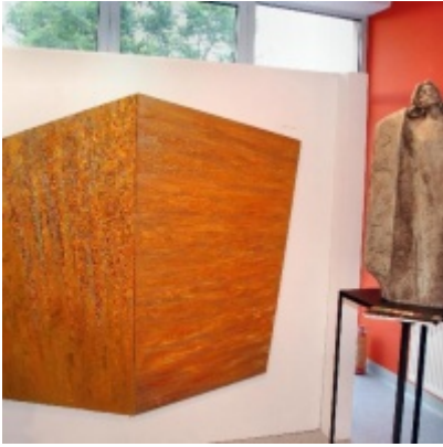
Regionalny Ośrodek Kultury Doliny Karpia w Zatorze