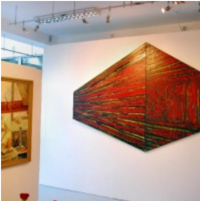
Regionalny Ośrodek Kultury Doliny Karpia w Zatorze