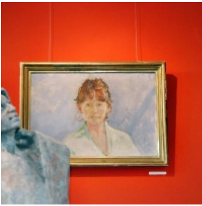
Regionalny Ośrodek Kultury Doliny Karpia w Zatorze