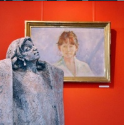
Regionalny Ośrodek Kultury Doliny Karpia w Zatorze