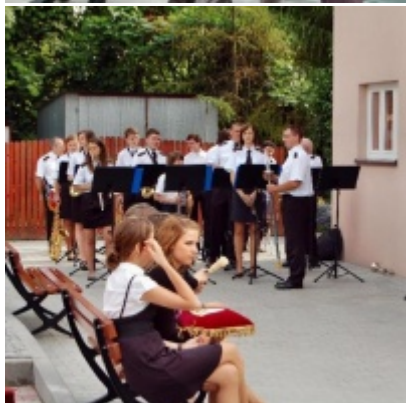
Regionalny Ośrodek Kultury Doliny Karpia w Zatorze