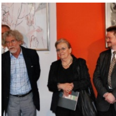
Regionalny Ośrodek Kultury Doliny Karpia w Zatorze