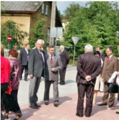
Regionalny Ośrodek Kultury Doliny Karpia w Zatorze