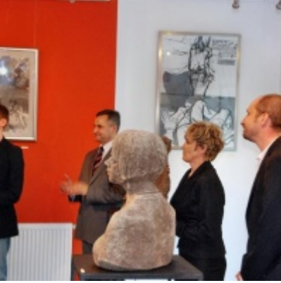
Regionalny Ośrodek Kultury Doliny Karpia w Zatorze