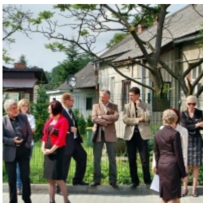
Regionalny Ośrodek Kultury Doliny Karpia w Zatorze