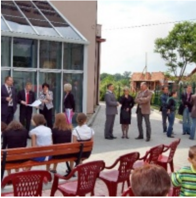
Regionalny Ośrodek Kultury Doliny Karpia w Zatorze