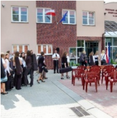
Regionalny Ośrodek Kultury Doliny Karpia w Zatorze