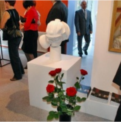
Regionalny Ośrodek Kultury Doliny Karpia w Zatorze