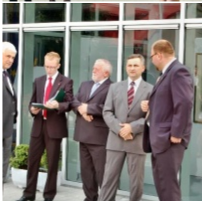
Regionalny Ośrodek Kultury Doliny Karpia w Zatorze