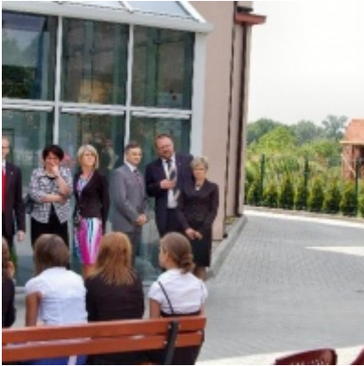
Regionalny Ośrodek Kultury Doliny Karpia w Zatorze