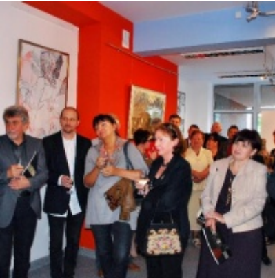
Regionalny Ośrodek Kultury Doliny Karpia w Zatorze