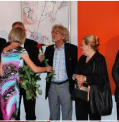
Regionalny Ośrodek Kultury Doliny Karpia w Zatorze