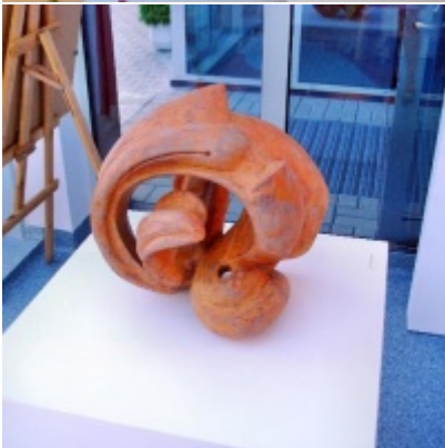
Regionalny Ośrodek Kultury Doliny Karpia w Zatorze