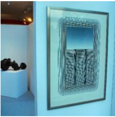
Regionalny Ośrodek Kultury Doliny Karpia w Zatorze