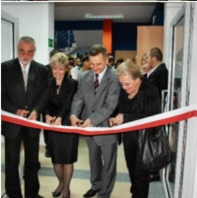
Regionalny Ośrodek Kultury Doliny Karpia w Zatorze