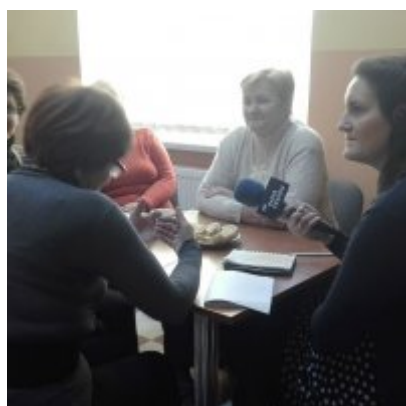
Przedświąteczne nagrania z Radiem Kraków